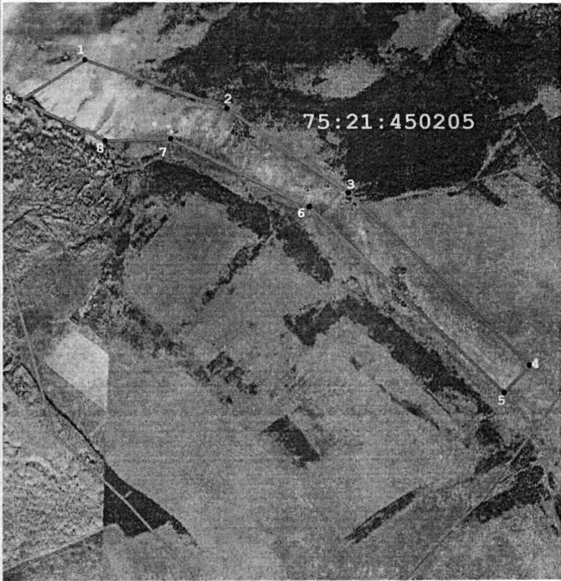
Масштаб 1:20 000