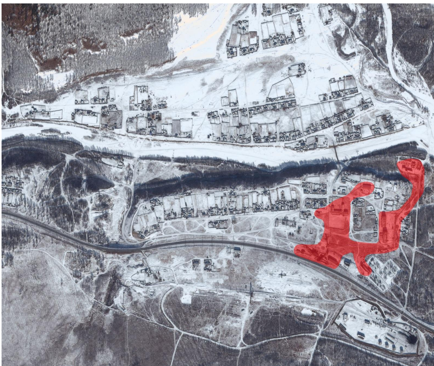
Рис.9.1 – Зона действия котельной ДПКС

Зона действия котельной – п.ст.Урюм, теплоисточник обеспечивает нужды поселения на отопление с присоединенной тепловой нагрузкой 0,850 Гкал/ч. Зона действия теплоснабжения представлена на рис. 9.1.