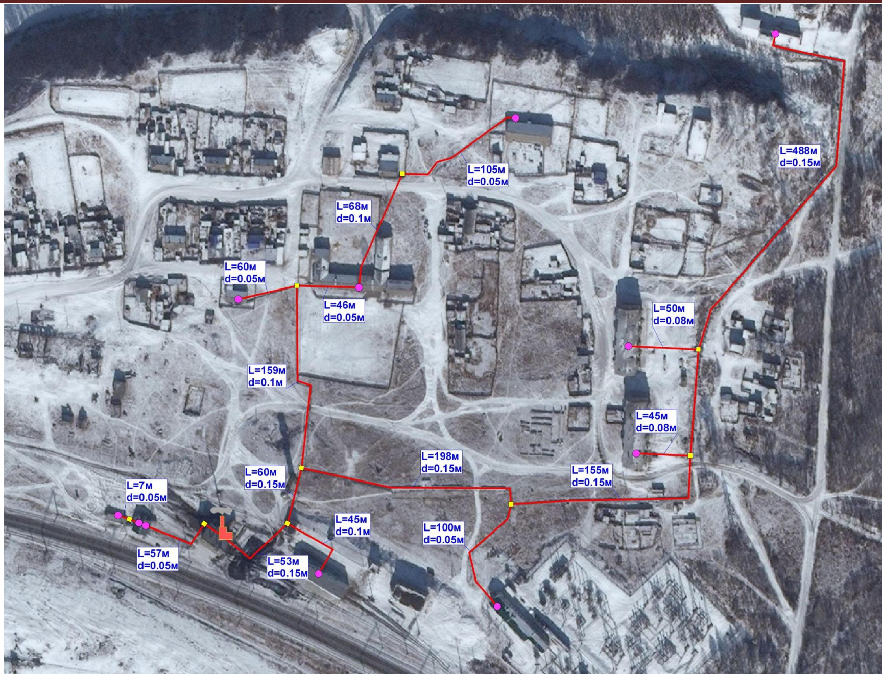
Рис.2.2 – Схема теплоснабжения п.ст.Урюм