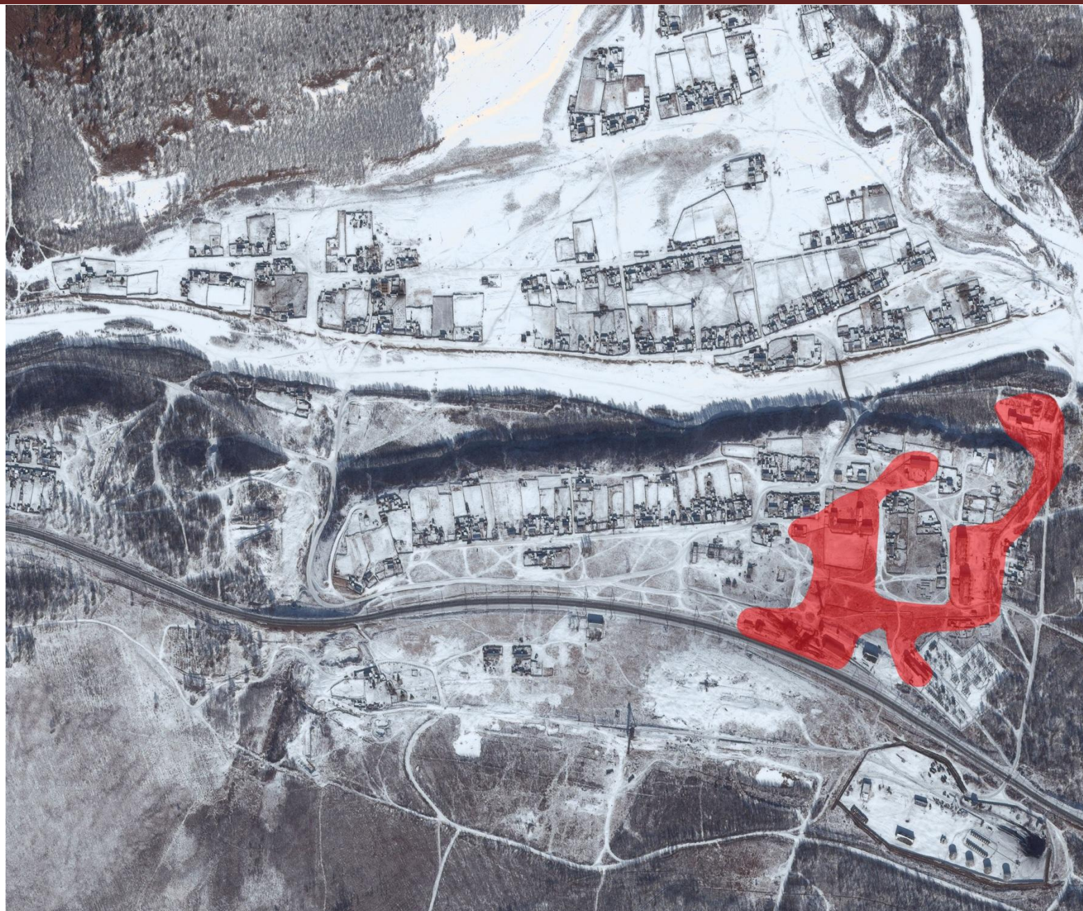
Рис.2.1 – Зона действия котельной ДПКС