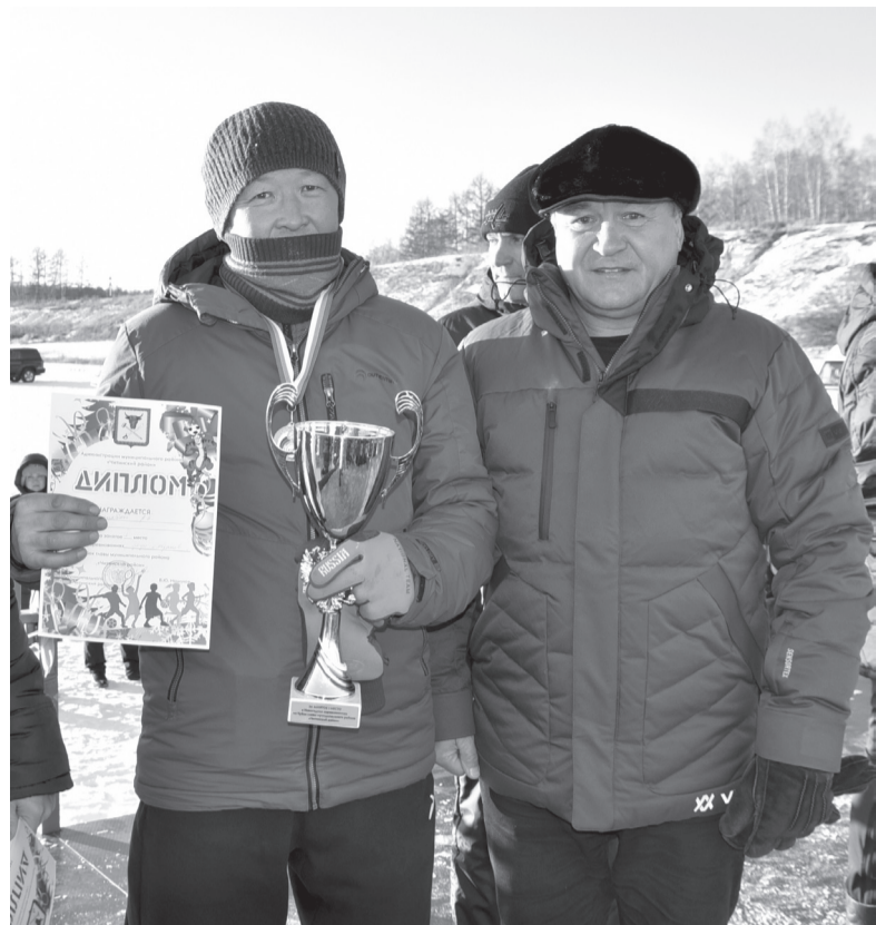
Фестиваль зимних видов спорта «Снежные Т-Игры» прошел в первые дни января на озере Арахлей на территории одноименного спортивного лагеря. На праздник съехались

более 150 участников из Читы, сёл Угдан, Арахлей, Беклемишево.