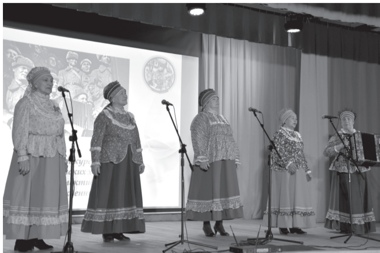
6 мая на сцене Дома культуры села Смоленка после двухлетнего перерыва вновь собрались ветеранские хоровые коллективы Читинского района.

Традиционный конкурс-фестиваль в этом году носил название «Песни, рожденные войной». Своё творчество представили шесть ветеранских хоров из Угдана, Засопки, Верх-Читы, Маккавеево, Атамановки и Смоленки.