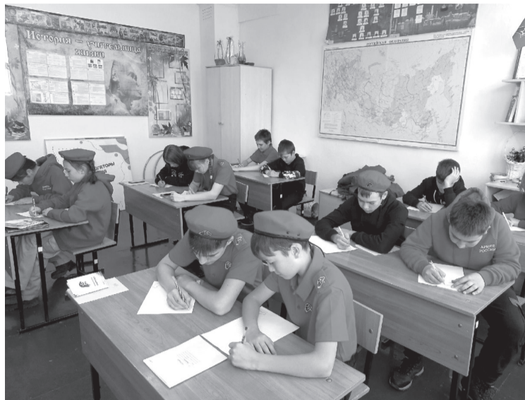
Юнармейский отряд «Орлята» МОУ СОШ п.ст. Гонгота принял участие в акции «Письмо солдату».