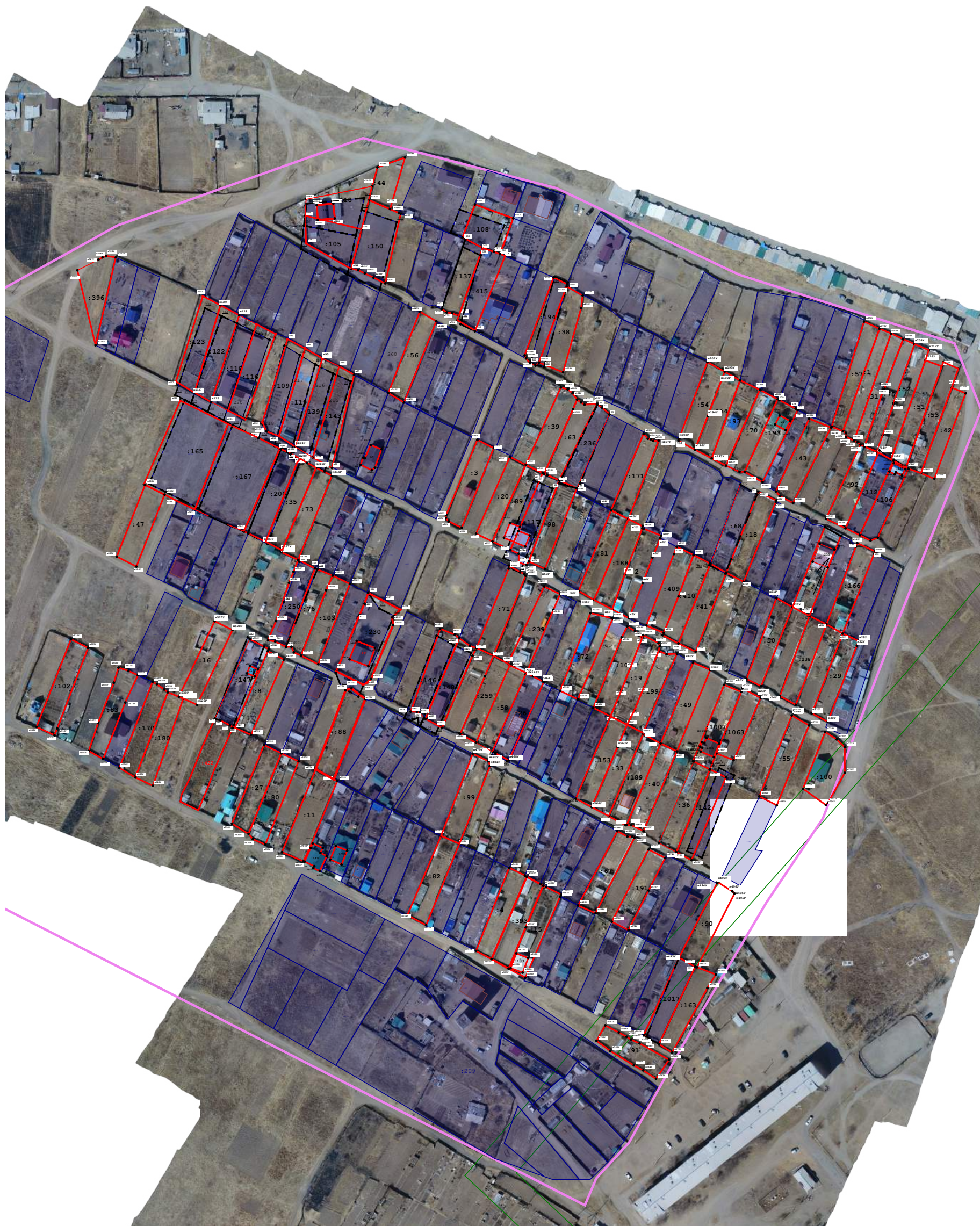
Масштаб 1:2 300