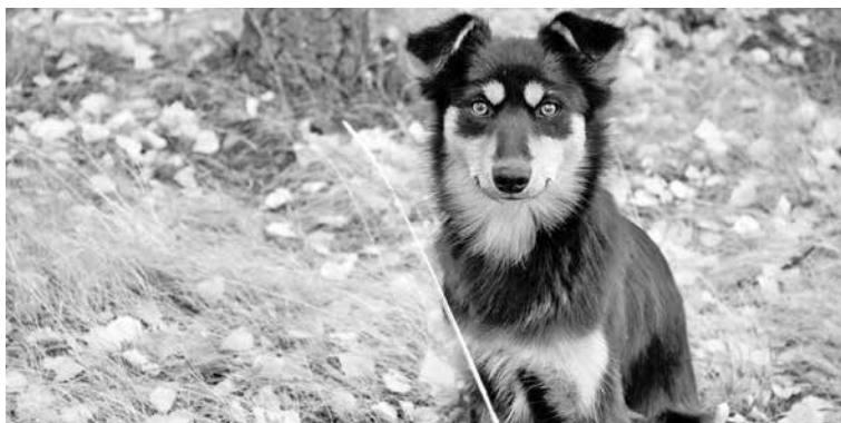
Бродячие животные — социальная и экологическая проблема.

Замечено, что с окончанием дачного периода возрастает количество бездомных животных. В современном мире этому не удивляешься: детей бросают, а что говорить про кошек и собак! Причина — в людской безответственности.