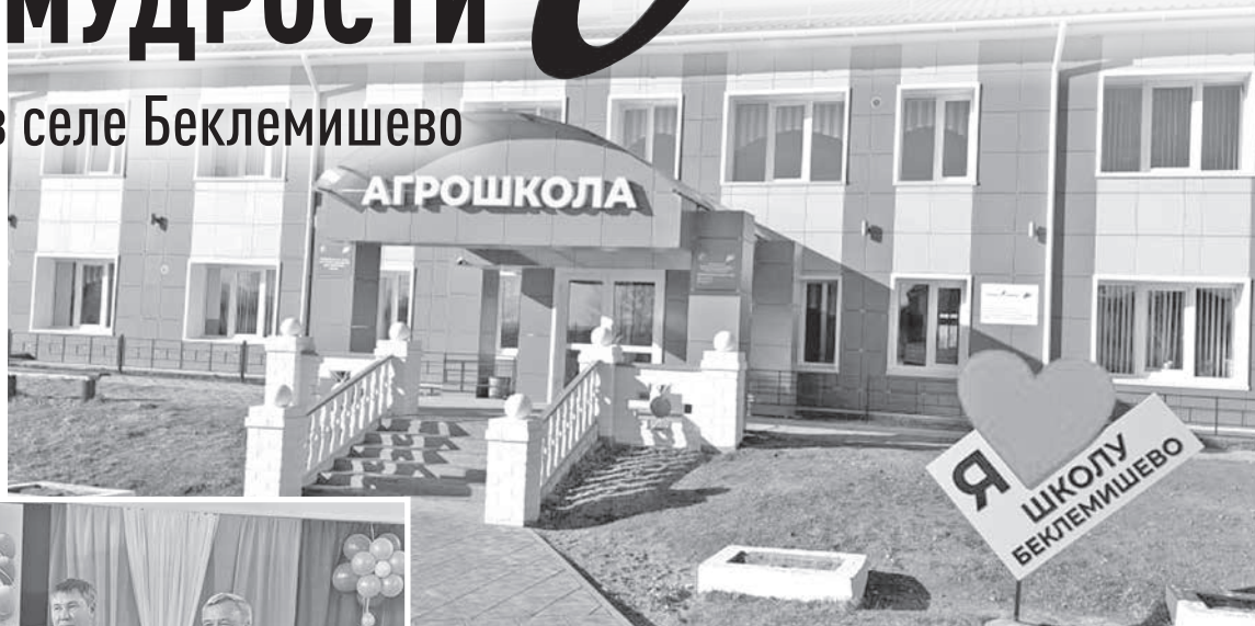
Юбилей школы – это всегда большой праздник, историческое событие.