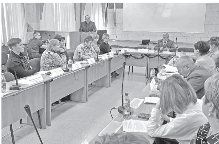
Консультативный совет — возможность собраться вместе и составить конструктивный диалог.