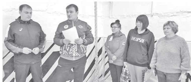
Спортсмены и их наставники понимают: в единении наша сила.

В пгт Атамановка состоялся благотворительный турнир по самбо и боевому самбо. Посвятили это событие нашим забайкальским воинам, участвующим в специальной военной операции.