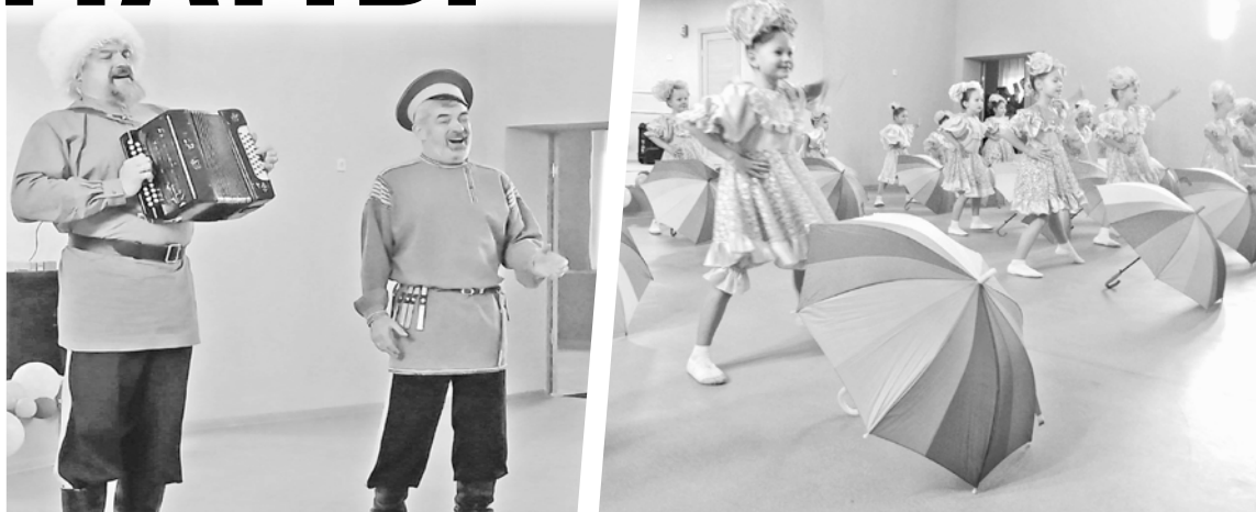
Празднование Дня матери стало ярким событием в нашем районе.

Сюрпризом для женщин стало видеобращение участников специальной военной операции, которые были призваны и мобилизованы с Атамановки. Ребята поздравили своих мам с праздником и выразили благодарность за их любовь, заботу и поддержку. В заключение встречи мамам вручили цветы