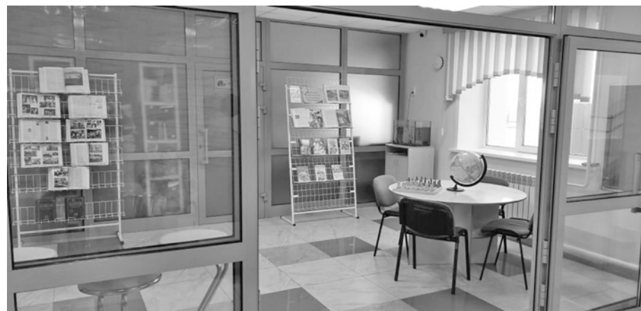
Помощь федерального центра значительно улучшает условия для воспитания и обучения юных забайкальцев.

Ежегодно с 2018 года в школах и детских садах реализуются мероприятия по улучшению условий для воспитания и обучения. Одним из ярких примеров этого года стало открытие школы в селе Смоленка (микрорайон Добротный). Ремонт выполнен в рамках реализации национального проекта «Образование», созданного по указу президента РФ Владимира