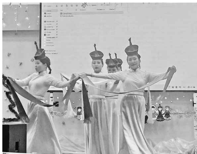
Год педагога был ярким и насыщенным.

ла педагогов, пожелала профессиональных успехов и новых достижений.