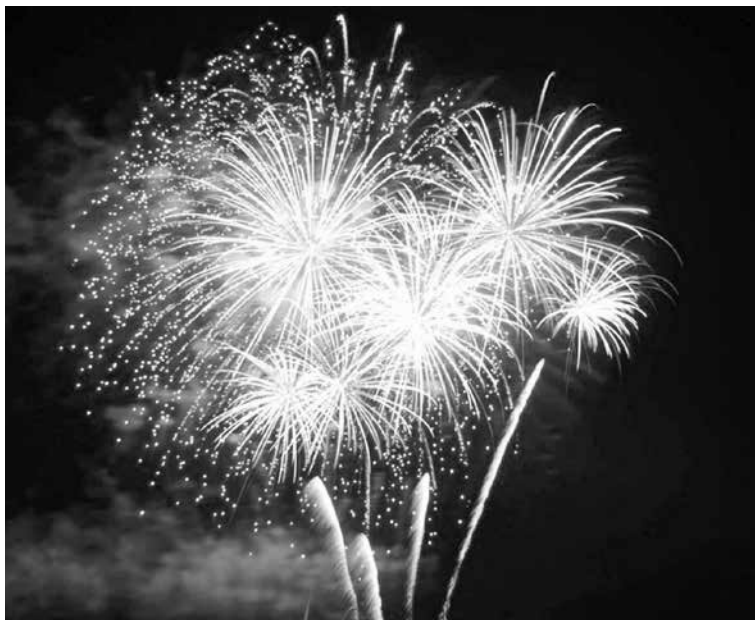
Фейерверки — огнеопасные изделия и требуют повышенного внимания при обращении с ними.

Не допускается применение изделий с истекшим сроком годности, следами порчи, без инструкции по эксплуатации