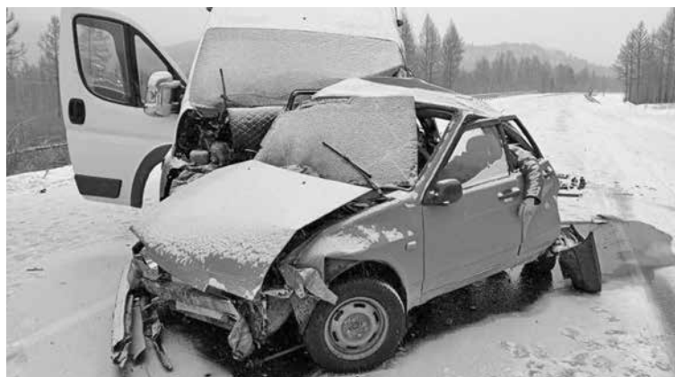
Соблюдая правила, ДТП можно было бы не допустить.

Выезд на полосу встречного движения в местах, где это запрещено, влечет наложение административного штрафа в размере 5 000 рублей или лишение права управления на срок от 4 до 6 месяцев. Данное правонарушение, совершенное повторно, влечет лишение права управления автотранспортом на 1 год.