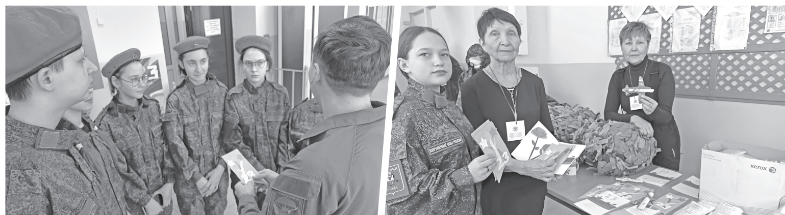
Наш район гордится защитниками Отечества и поддерживает наших военнослужащих.

В Смоленке и Новой Куке среди школьников прошёл