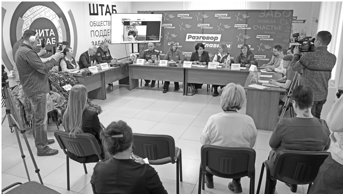
Штаб общественной поддержки объединил волонтерские организации Забайкалья/

Специальная военная операция по денацификации и демилитаризации Украины началась ровно два года назад, в феврале 2022-го. За эти два года плакатные слова «Всё для фронта» стали нашей реальностью.