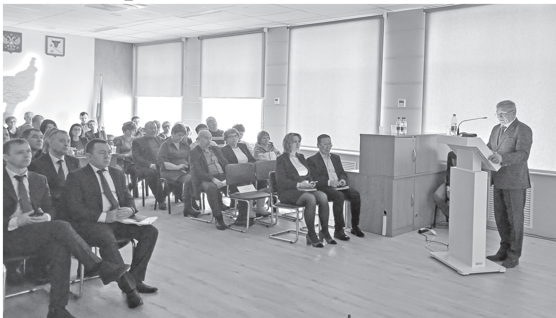
Совет депутатов единогласно признал деятельность главы в 2023 году удовлетворительной.

Что касается социальной сферы, приведём такие факты: в 2023 году в рамках программы «Модернизация школьных систем образования» отремон-