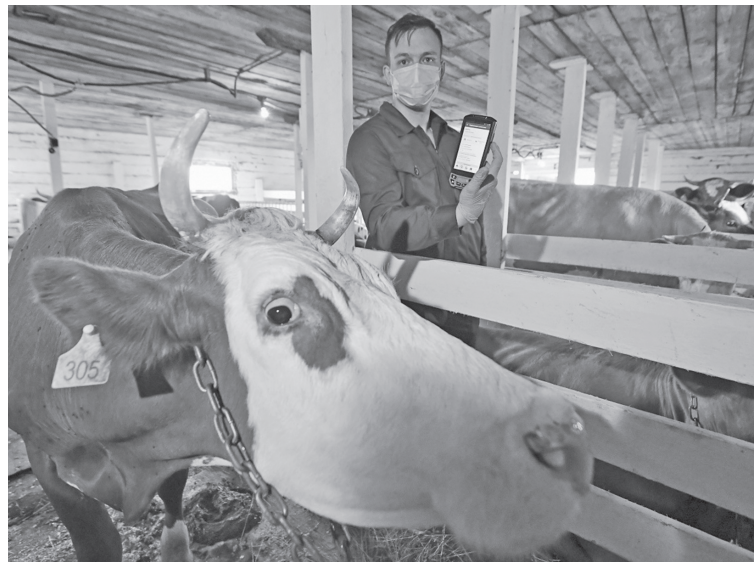
Идентификация животных – главный залог безопасности.

ФГИС «ВетИС» «Цербер» предназначен для хранения и управления реестром подконтрольных Россельхознадзору объекту, а также для подачи заявок на государственную регистрацию производствен-