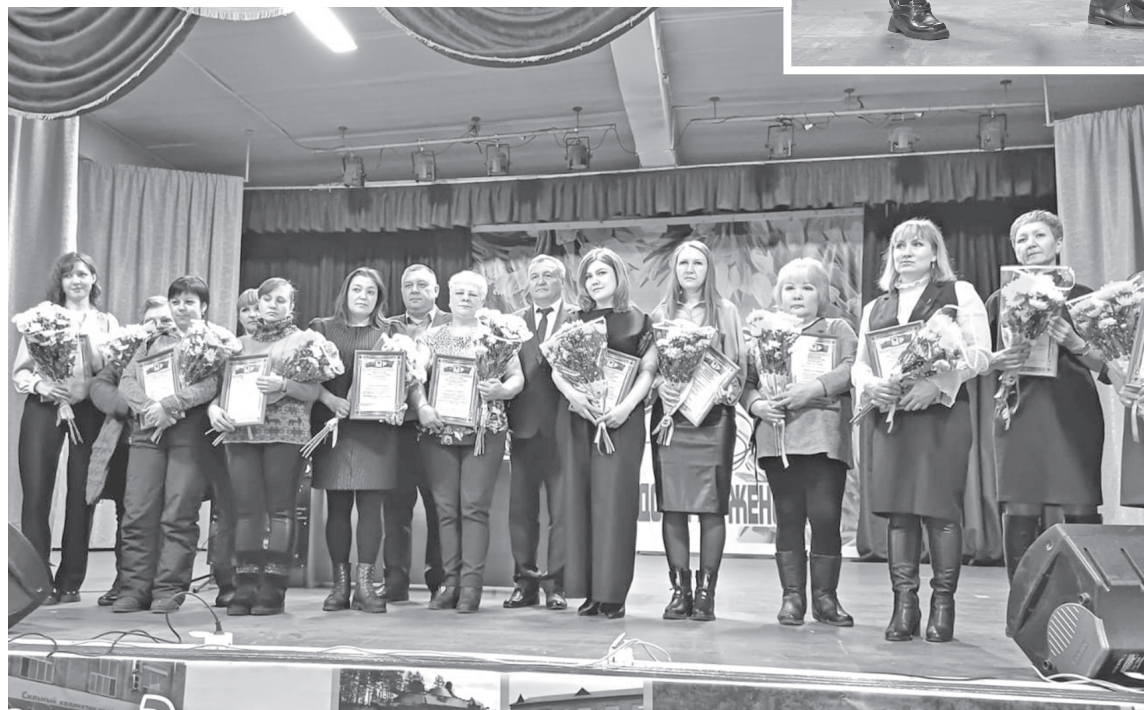
Пусть новая весна принесёт всем женщинам радость и мир в семье!

была организована выставка изделий, а ребята из отряда «Миротворец» приняли участие во Всероссийской акции «Цветы для любимой женщины».