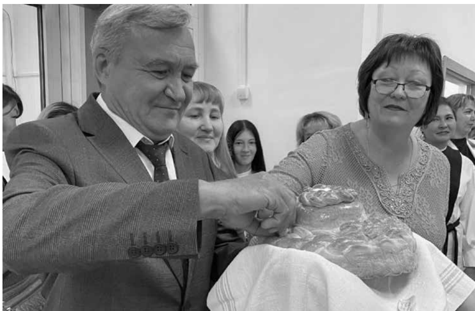
Уважаемые жители Читинского района!

С началом нового учебного года в воздухе витает особая атмосфера ожидания и вдохновения. Школы и университеты вновь открывают свои двери, приглашая молодых людей на путь знаний и самосовершенствования.