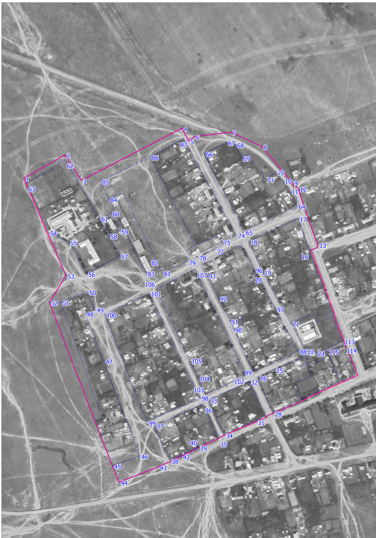
1.6. Каталог координат границ территориальной зоны ТОП – Земельные участки (территории) общего пользования