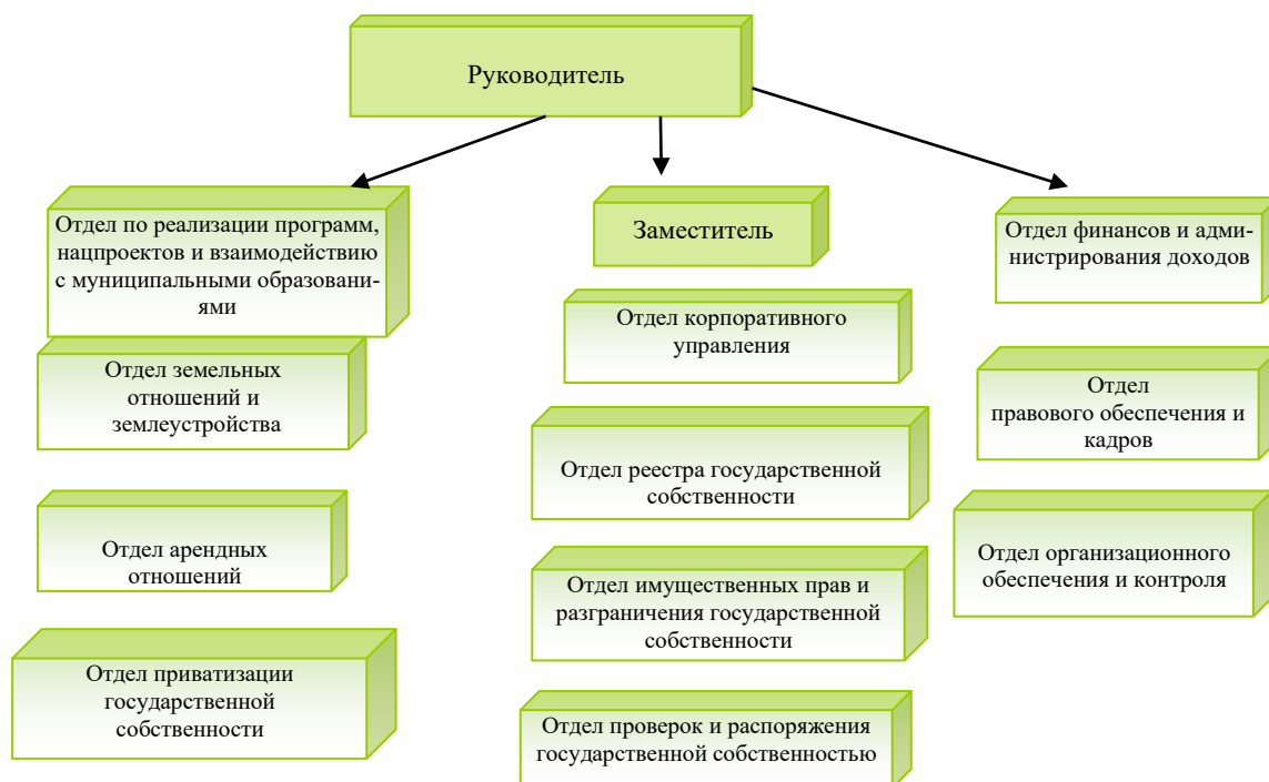
Организационная структура Департамента