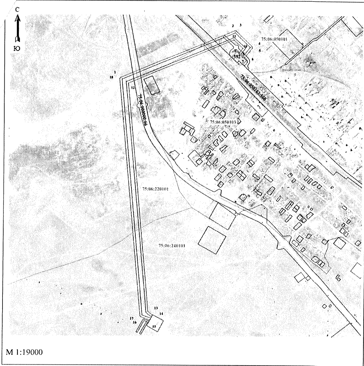
Схема расположения границ публичного сервитута ВЛ 110 кВ ПС Даурия - ТПС Даурия, 1 и 2 цепь