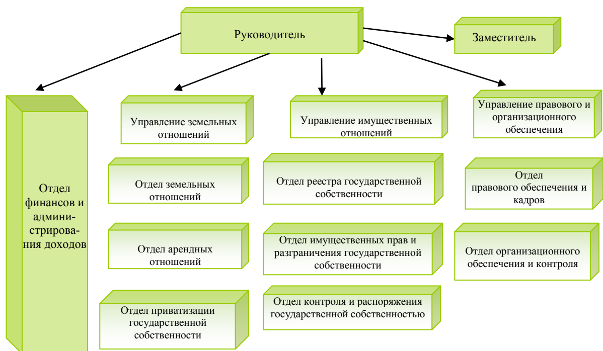
Организационная структура Департамента