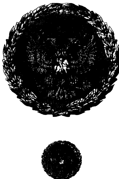
РИСУНОК НАГРУДНОГО ЗНАКА К ПОЧЕТНОЙ ГРАМОТЕ ПРЕЗИДЕНТА РОССИЙСКОЙ ФЕДЕРАЦИИ

Утвержден Указом Президента Российской Федерации от 11 апреля 2008 г. N 487