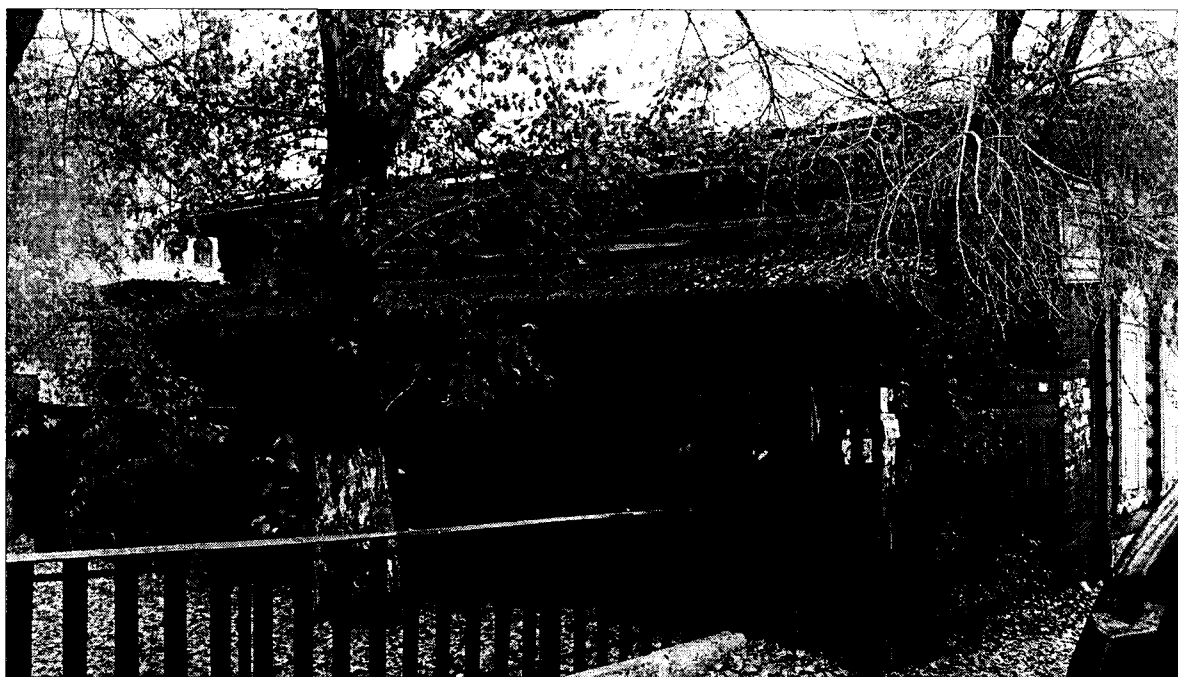
Фото 2 Вид открытой веранды с юго-востока