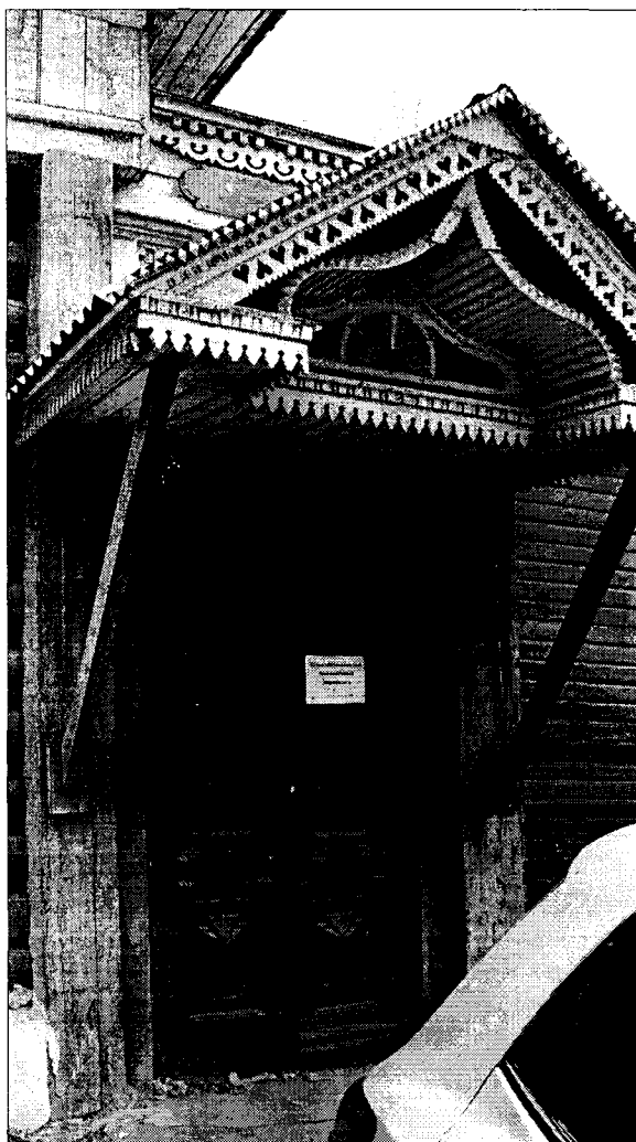
фото 4. Фрагмент северо-восточного фасада. Парадный вход.