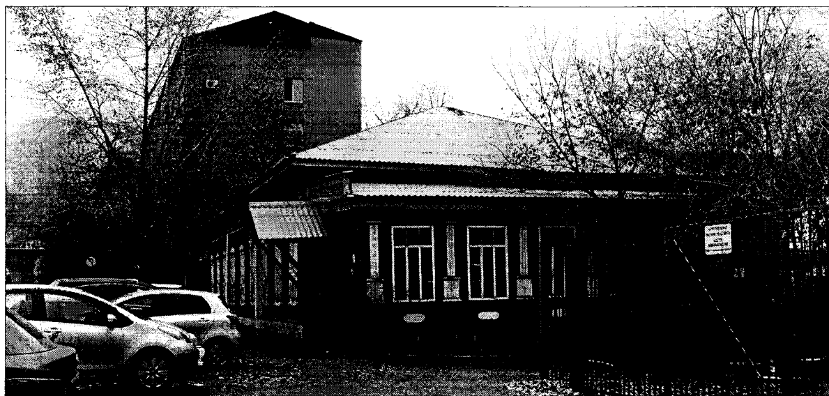
Фото1 вид с севера.