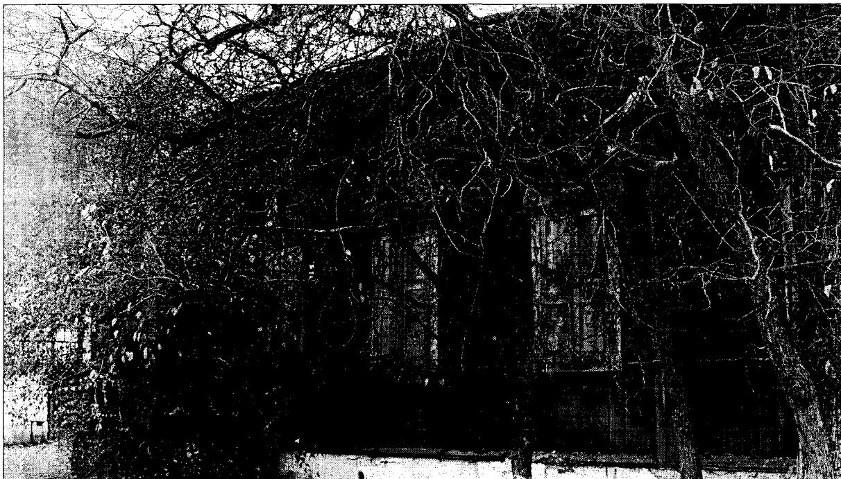
Фото 5 Фрагмент юго-западного фасада

«Усадьба Бард Р.Л. Дом жилой», ул. Лермонтова, 3