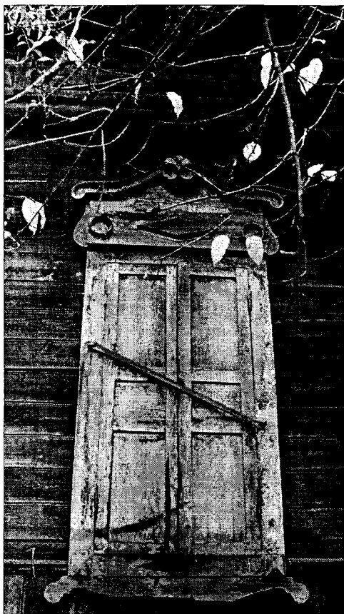
Фото 6 Наличник юго-западного дворового фасада