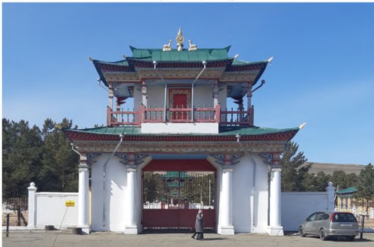
Место установки плиты с информационной надписью