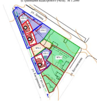
СХЕМА ГРАНИЦ ЗОН ОХРАНЫ ОКН (с границами кадастрового учета). М 1:2000