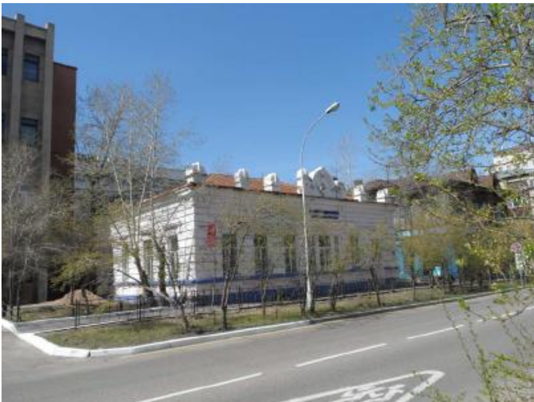
Восприятие ОКН «Дом жилой Соболева» по у Чайковского,17 с противоположной стороны ул. Чайковского