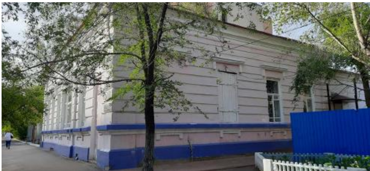
Восприятие ОКН «Дом жилой Соболева» по у Чайковского,17 с ул. дворовой территории