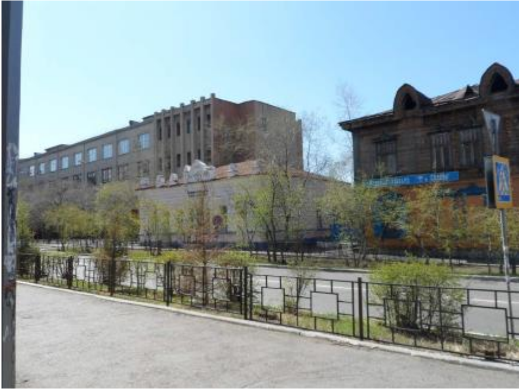
Восприятие с ул. Чайковского на ОКН «Дом жилой Соболева» по у Чайковского,17 (слева здания ГТС)

Результаты анализа графически представлены в виде схем: