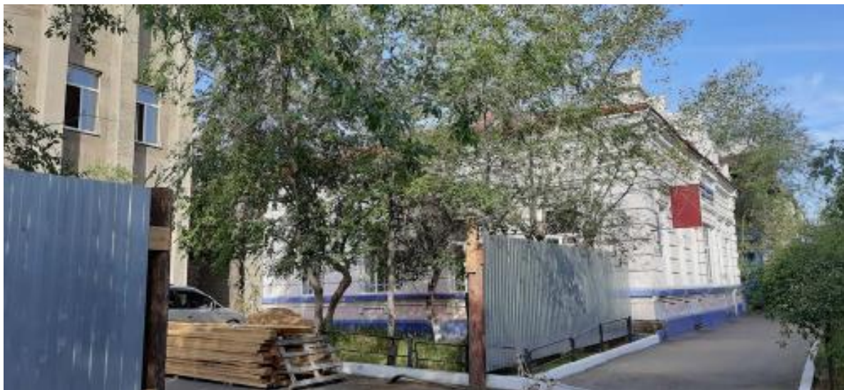
Восприятие ОКН «Дом жилой Соболева» по у Чайковского,17 с тротуара ул. Чайковского