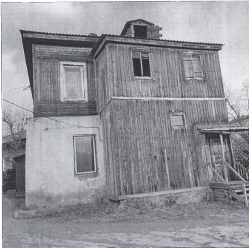
Фото 3 юго-западный фасад.