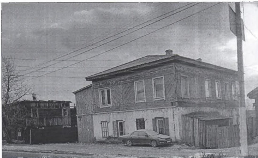
Фото 1. Главный северо-восточный фасад