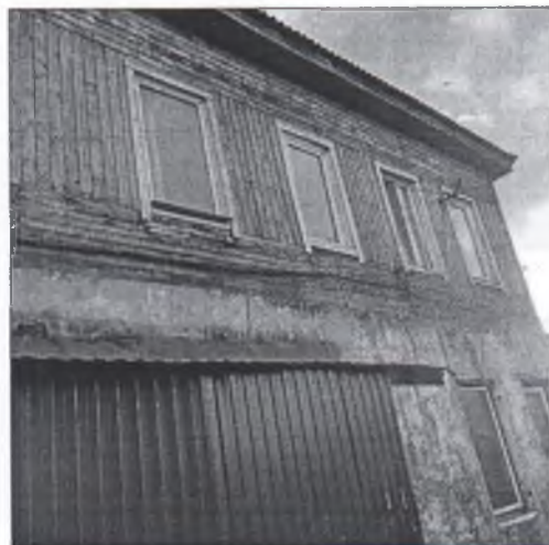
Фото 4,5 фрагменты северо-западного фасада