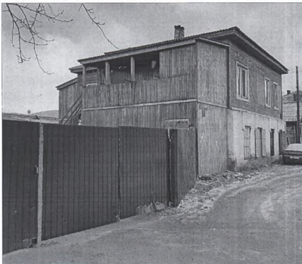
Фото 2. Вид с юго-востока, двухуровневая галерея.