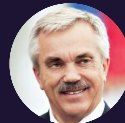
Савченко Евгений Степанович Губернатор Белгородской области