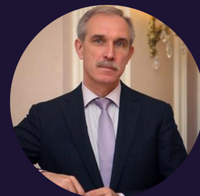
Морозов Сергей Иванович Губернатор Ульяновской области