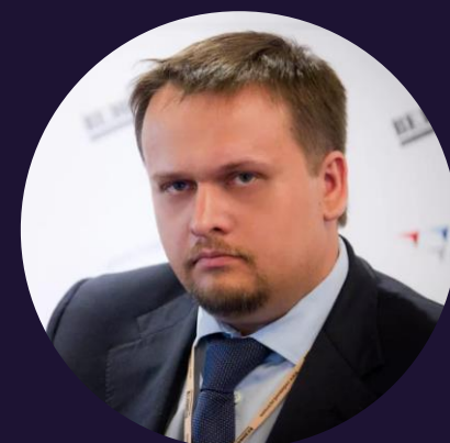
Никитин Андрей Сергеевич Губернатор Новгородской области