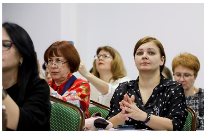
В ожидании нашего выхода. Сосредоточены.