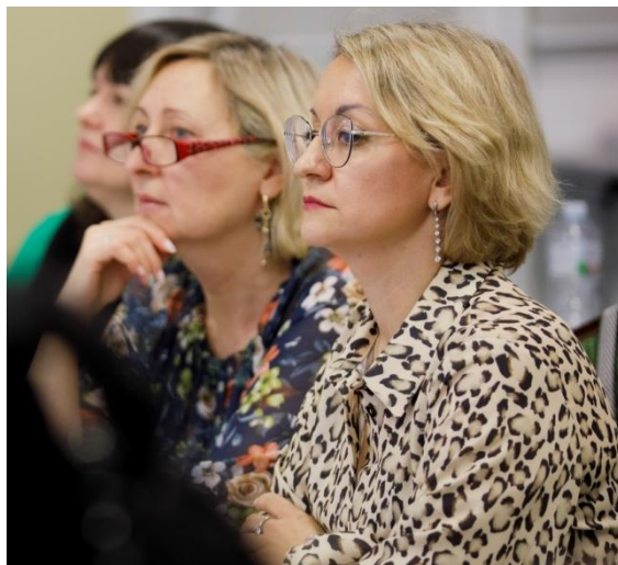
Наши коллеги - финалисты Российского конкурса из г. Новосибирска

Выполнили все условия. Ждем оценок. Пройдем ли на следующий этап? Новосибирцы демонстрируют полное спокойствие.