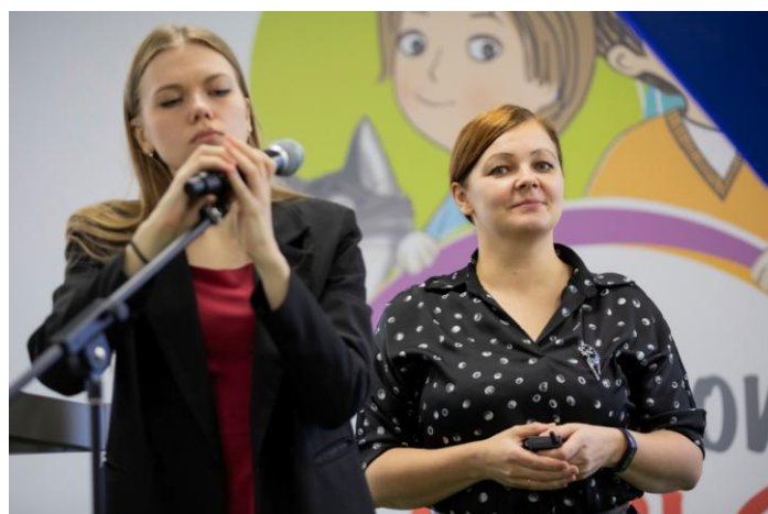
Удалась пауза, чтобы выдохнуть волнение, пока перед выступлением настраивали микрофон