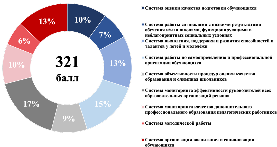
Рисунок 2 – Структура итогового балла

1.8. Максимальный итоговый балл по результатам проведения оценки составляет 321 балл. Структура итогового балла представлена на рисунке 2.