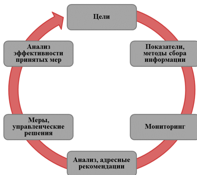
Рисунок 3 – Структура управленческого цикла

Реализация первых двух компонентов возможна через разработку регионами концептуальных документов (программ). Последующие четыре компонента реализуются через принятые регионами подходы (действия).