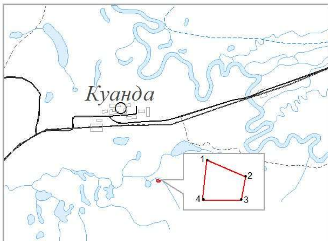
СХЕМА РАСПОЛОЖЕНИЯ УЧАСТКА НЕДР «ФЕДОРОВСКИЙ»