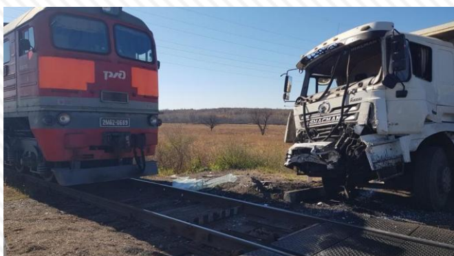
7 октября 2022 г. перегон Буряя - Амурская