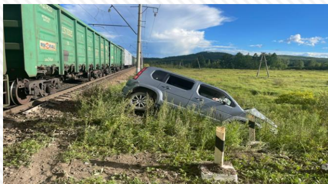
7 августа 2022 г. перегон Бушулей – Жирекен