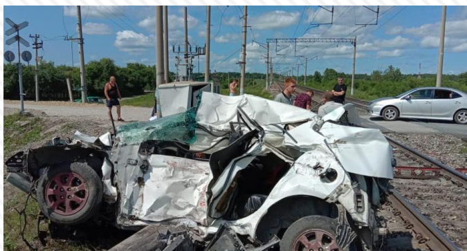
20 июля 2022 г. перегон Украина – Белогорск