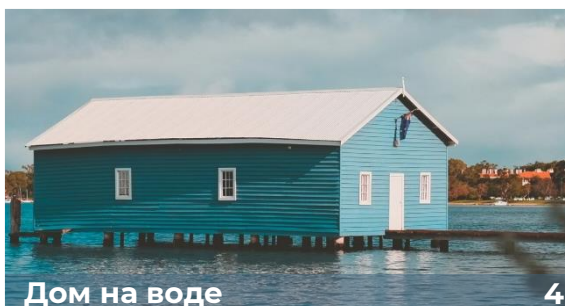
Дом на воде