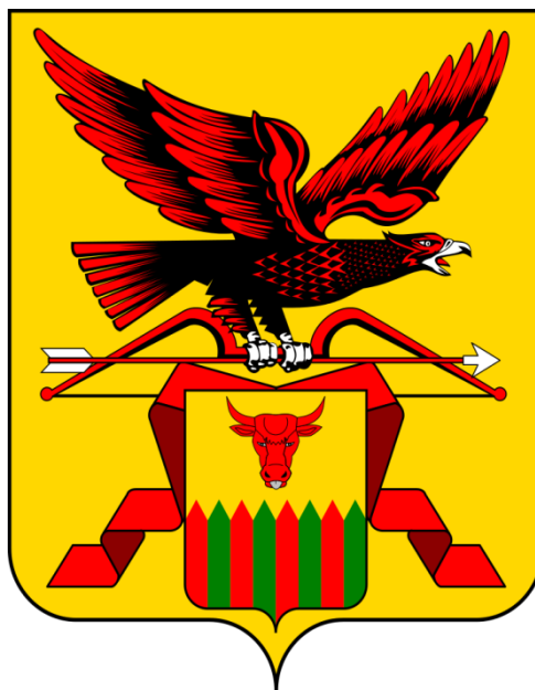
Схема водоотведения городского поселения «Амазарское» Могочинского района Забайкальского края до 2036 года