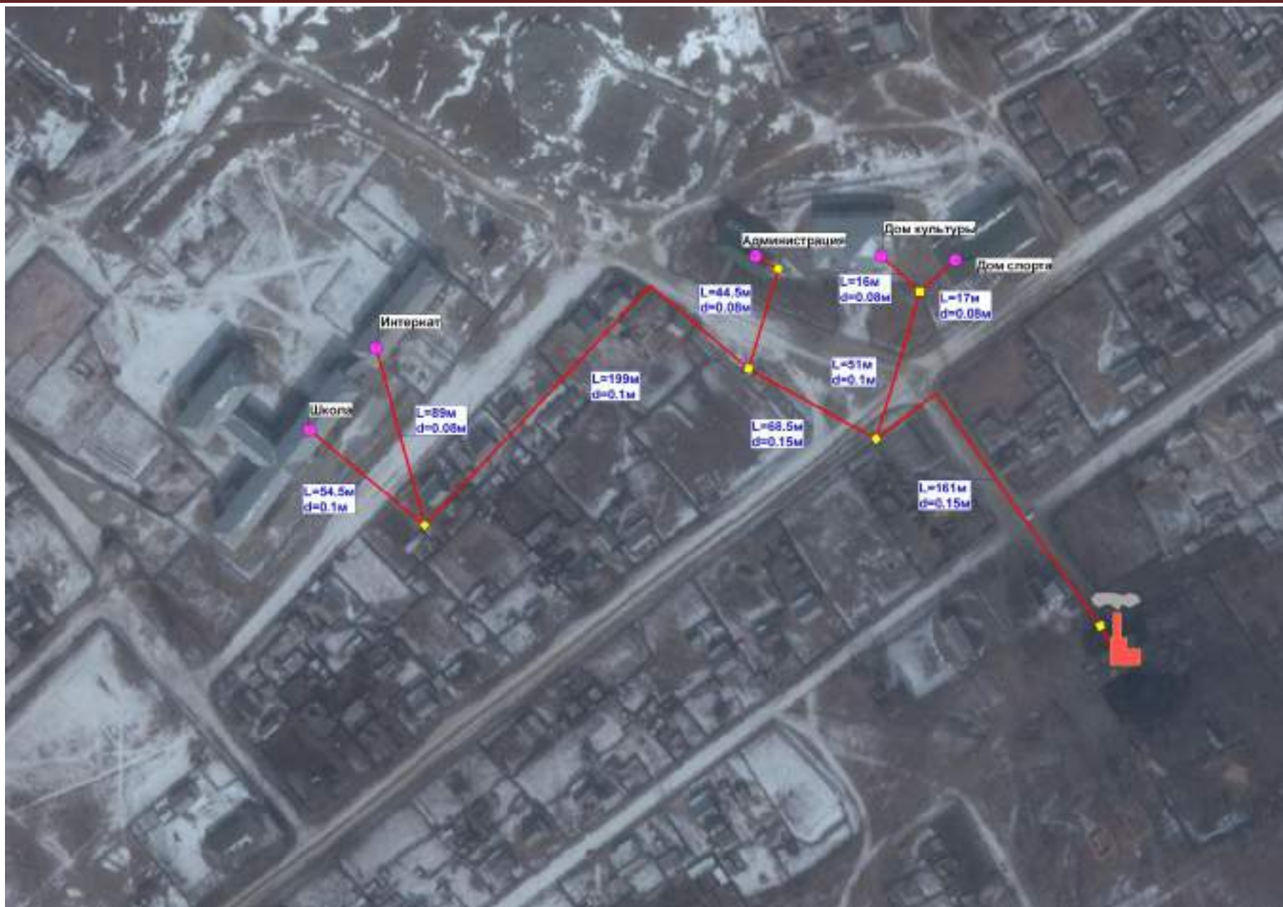
Рис.2.2 – Схема теплоснабжения центральной котельной