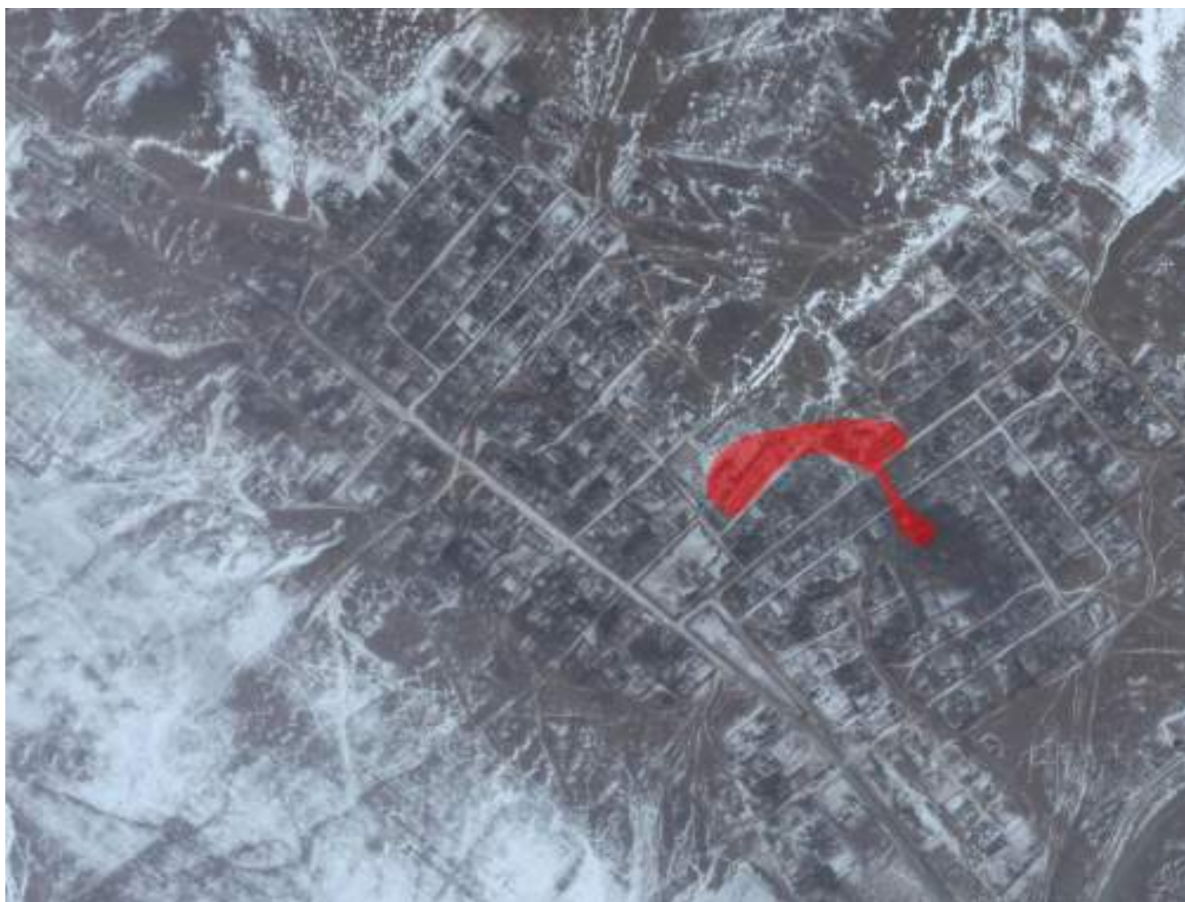
Рис.9.1 – Зона действия центральной котельной

Зона действия центральной котельной – село Зугалай, теплоисточник обеспечивает нужды поселения на отопление с подключенной тепловой нагрузкой 0,903 Гкал/ч. Зона действия теплоснабжения представлена на рис. 9.1.