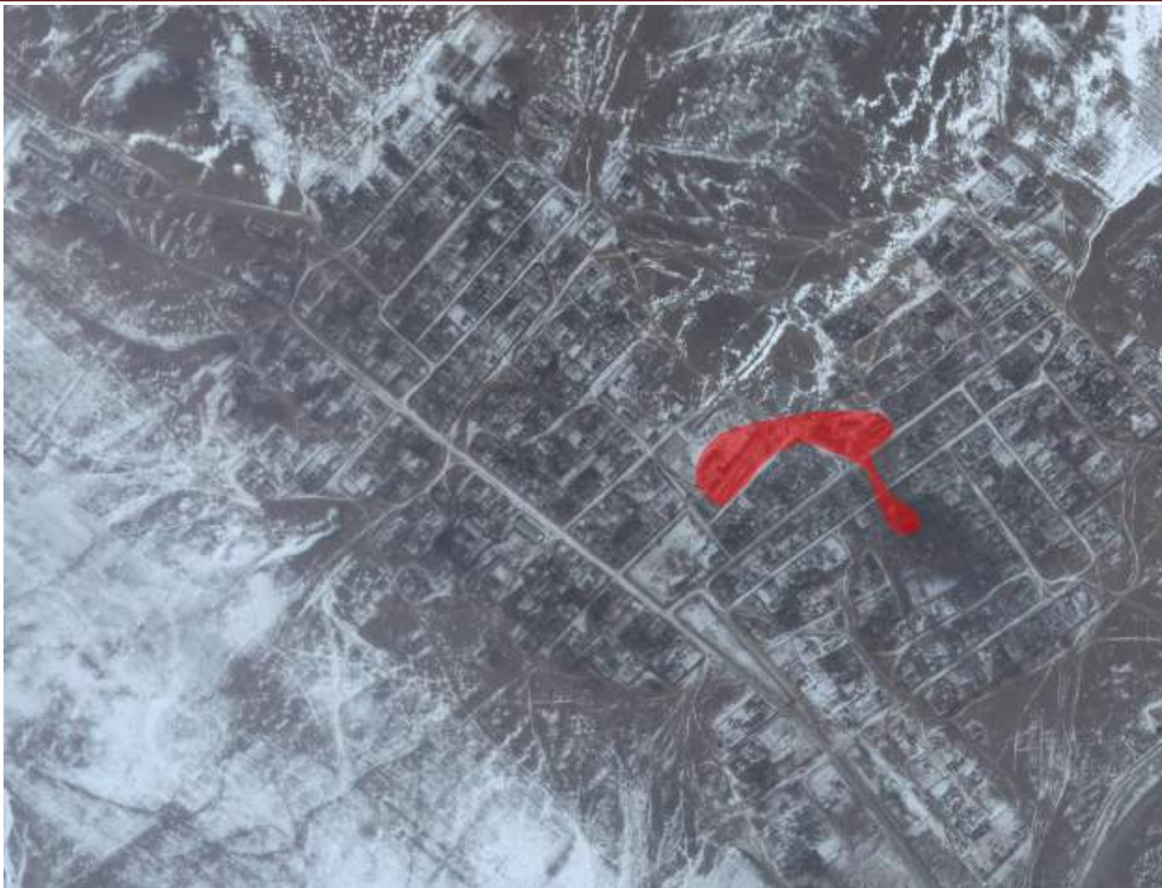
Рис.2.1 – Зона действия села Зугалай