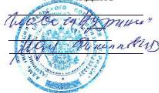
СХЕМА ТЕПЛОСНАБЖЕНИЯ СЕЛЬСКОГО ПОСЕЛЕНИЯ «НУРИНСК» МОГОЙТУЙСКОГО МУНИЦИПАЛЬНОГО РАЙОНА ЗАБАЙКАЛЬСКОГО КРАЯ ДО 2029 ГОДА