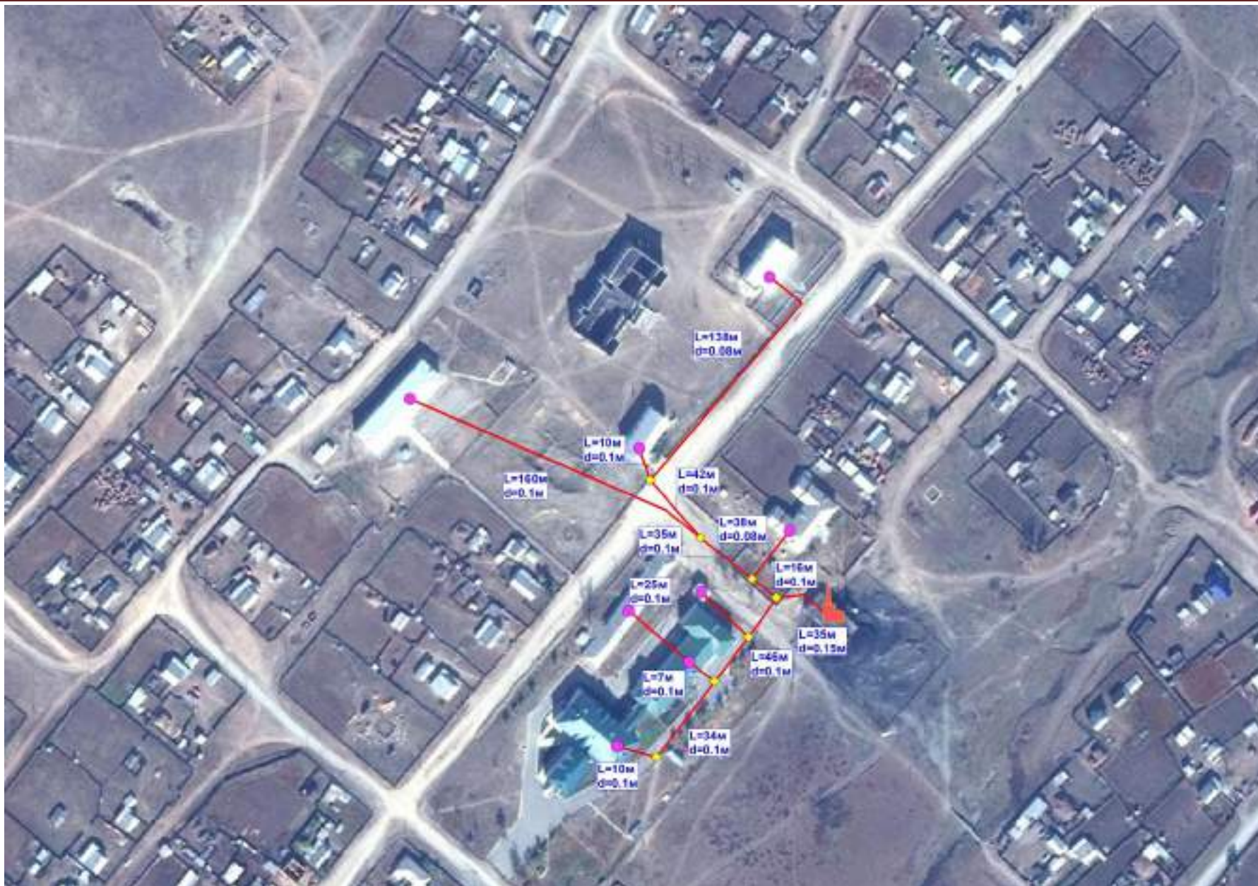
Рис.2.2 – Схема теплоснабжения центральной котельной