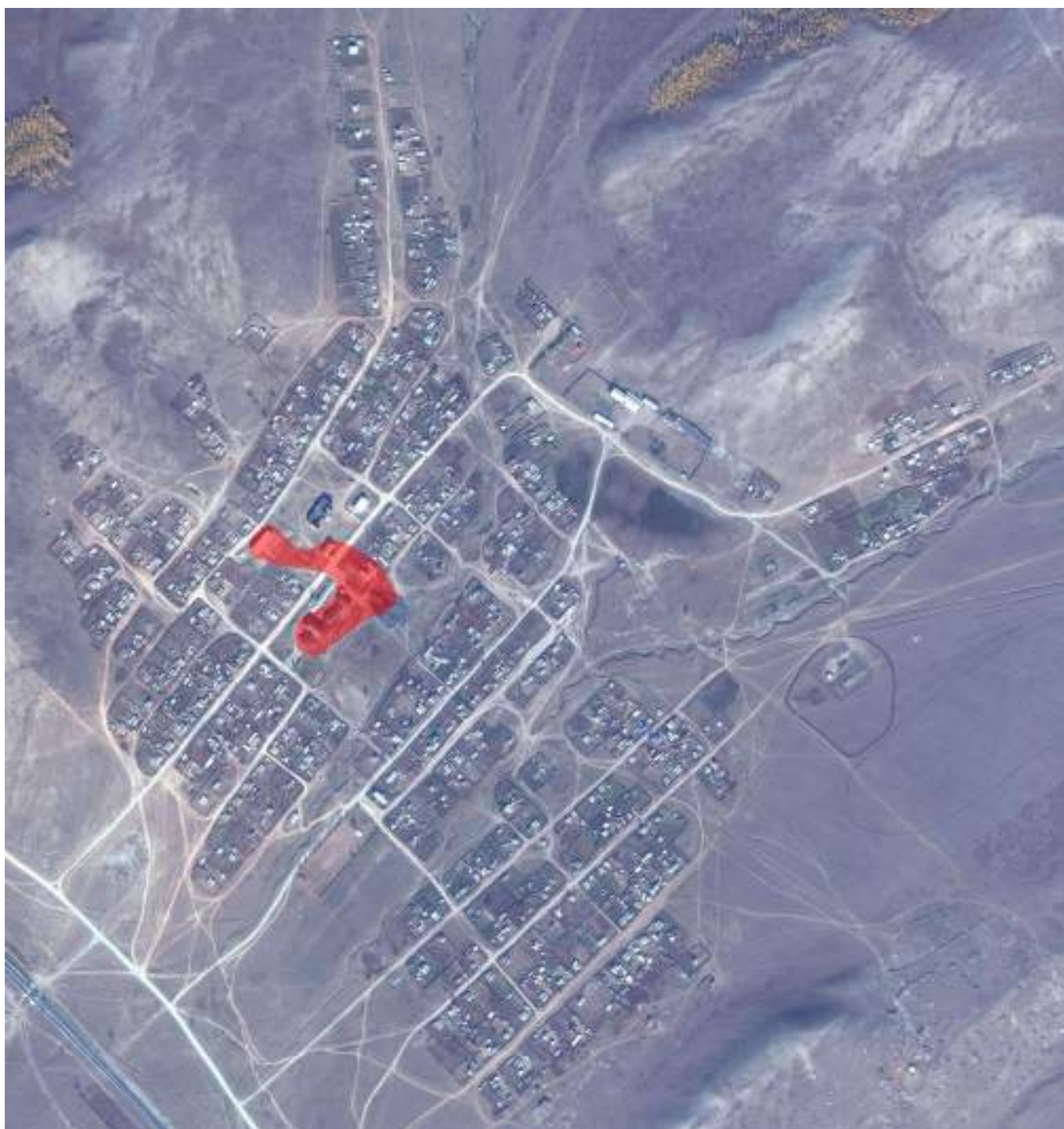
Рис.2.1 – Зона действия теплоснабжения села Ушарбай