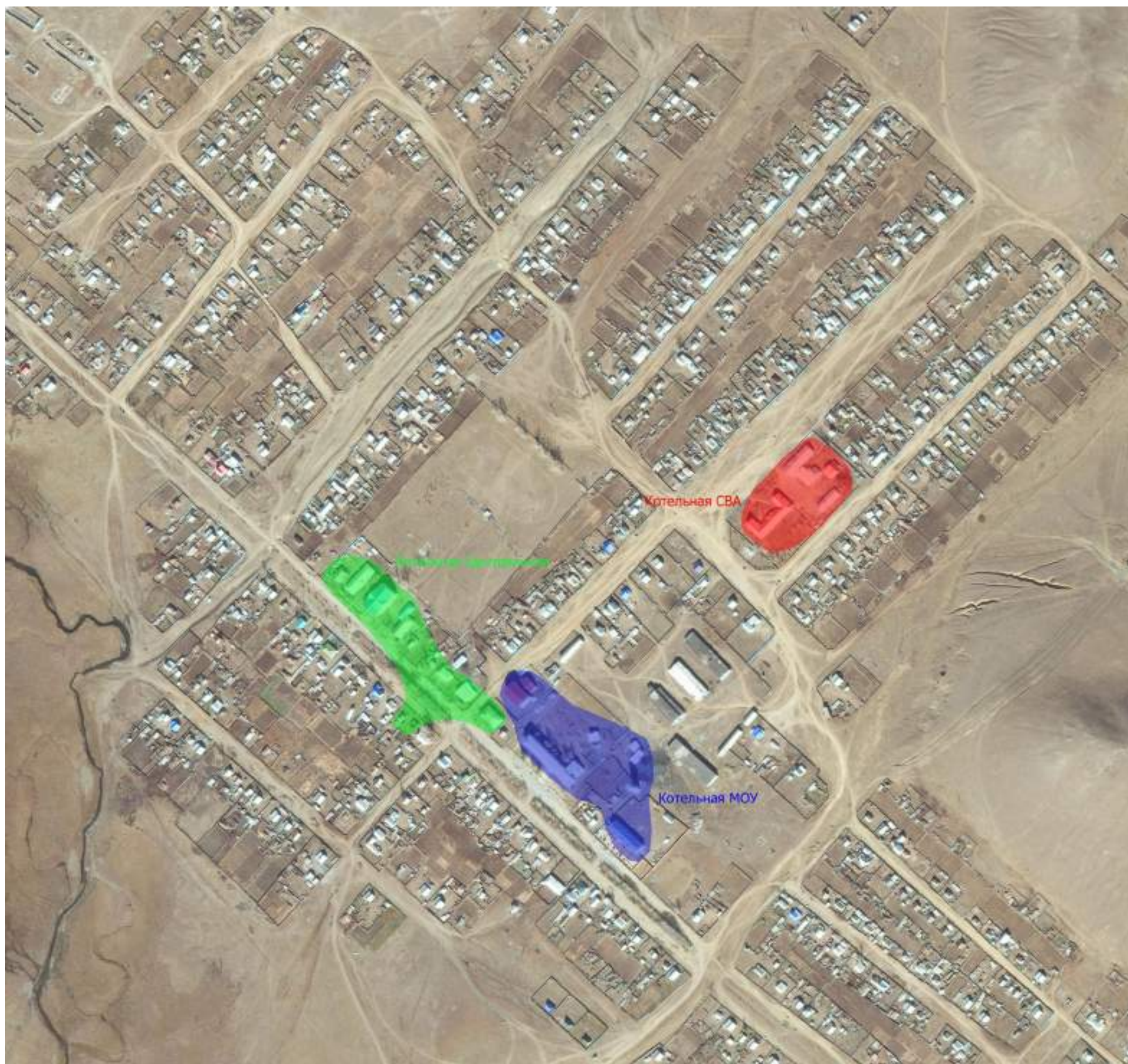
Рисунок 2.1 - Зоны действия систем теплоснабжения сельского поселения "Хара-Шибирь".