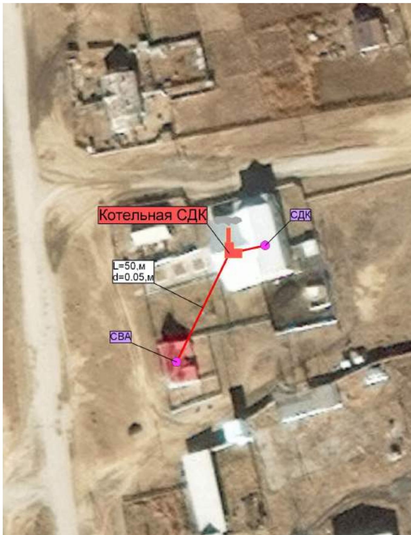
Рис. 2.3 – Схема теплоснабжения муниципального образования сельское поселение «Хила» от котельной СДК