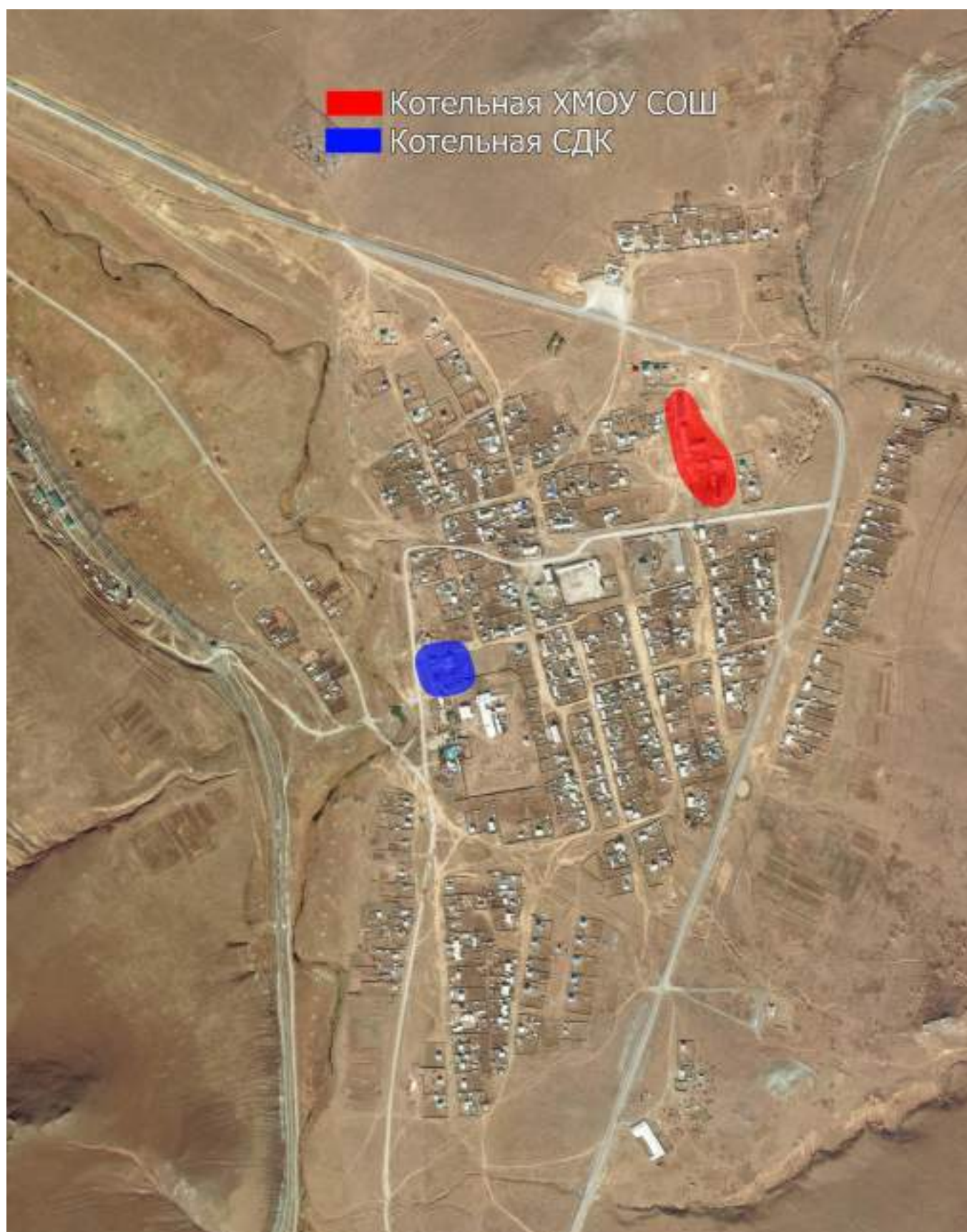
Рис. 2.1 – Зоны действия теплоснабжения муниципального образования сельское поселение «Хила».