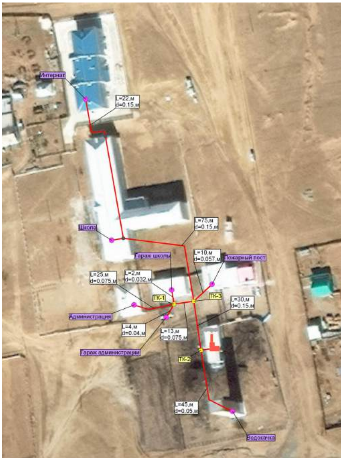
Рис. 2.2 – Схема теплоснабжения муниципального образования сельское поселение «Хила» от котельной ХМОУ СОШ.