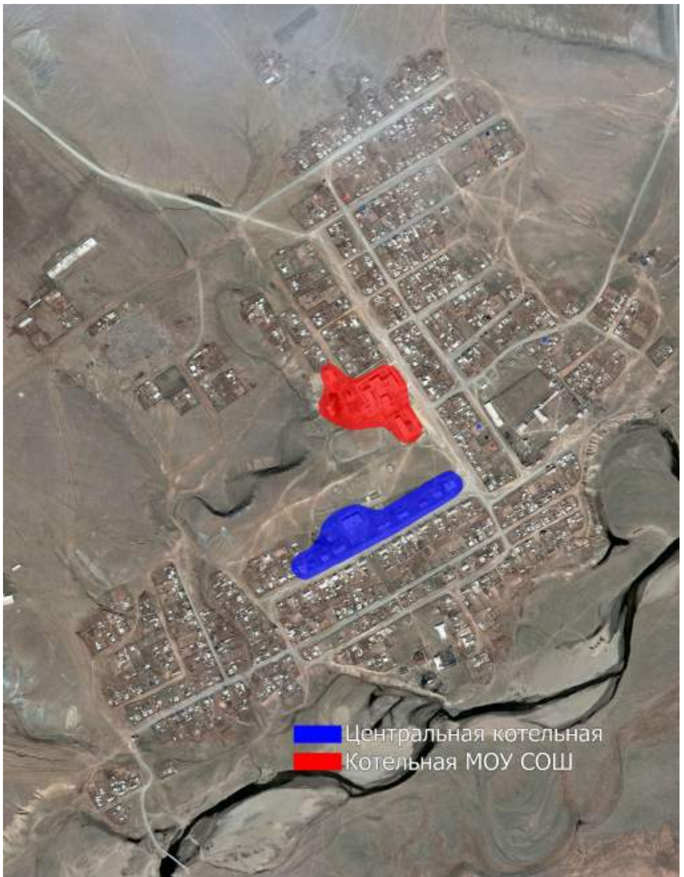
Рис. 2.1 – Зоны действия теплоснабжения муниципального образования сельское поселение "Цаган-Ола".