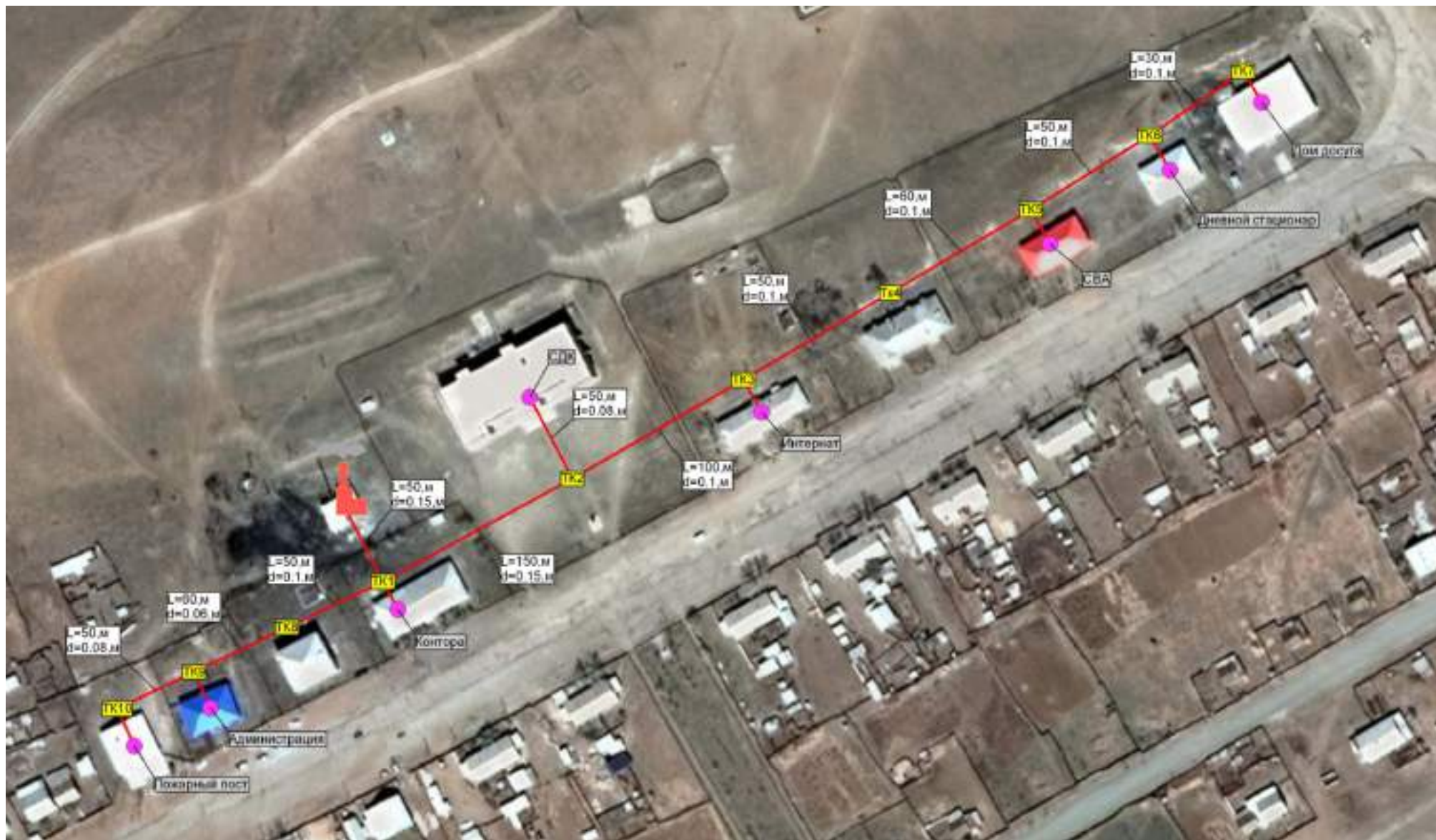
Рис. 2.2 – Схема теплоснабжения муниципального образования сельское поселение "Цаган-Ола" от центральной котельной