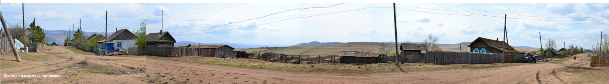
Фрагмент панорамы с. Горбуновское