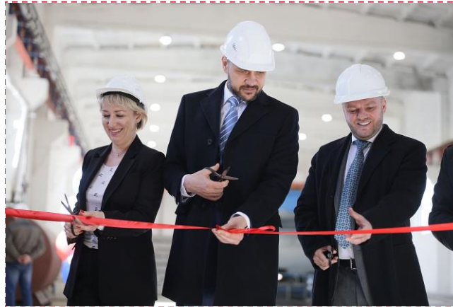
ООО «Мир» запустил новое направление – завод ЖБИ

За период деятельности мы профинансировали 228 производственных предприятий на общую сумму 1106,8 млн. руб. При нашей финансовой поддержке в крае запустилось 70 различных производств. Это запуск крупного завода железобетонных изделий, предприятие по производству фронтальных погрузчиков, выращивание саженцев сосны, уникальное производство трикотажных изделий и другие.