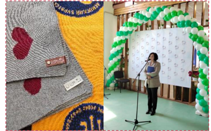
ИП Хан запустила производство шерстяных изделий