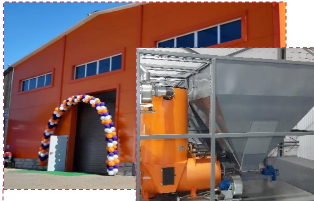
ООО «Карботэк-Техно» модернизировало производство модульных котельных