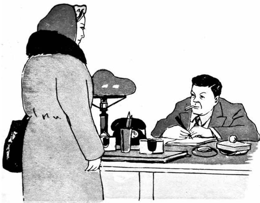
Рис. Л. БРОДАТЫ