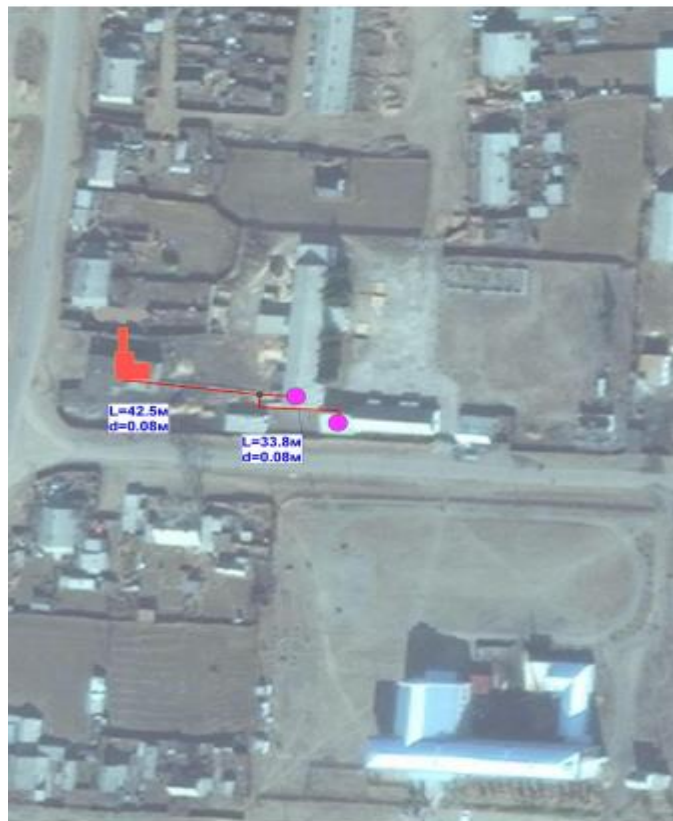
Рисунок 2. Зона действия котельной трудового центра с. Новопавловское ИНЗД - 1