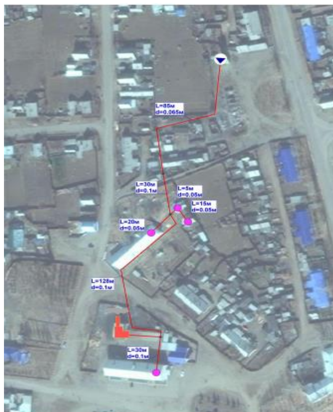
Рисунок 5. Зона действия котельной д/сада №7 с. Новопавловское ИНЗД – 3