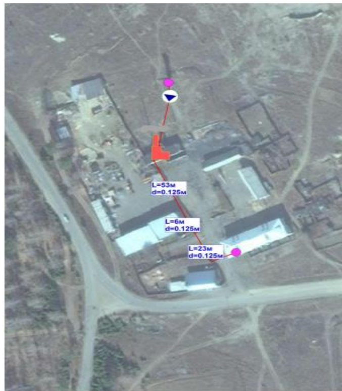
Рисунок 3. Зона действия котельной жилого дома с. Новопавловское ИНЗД – 2