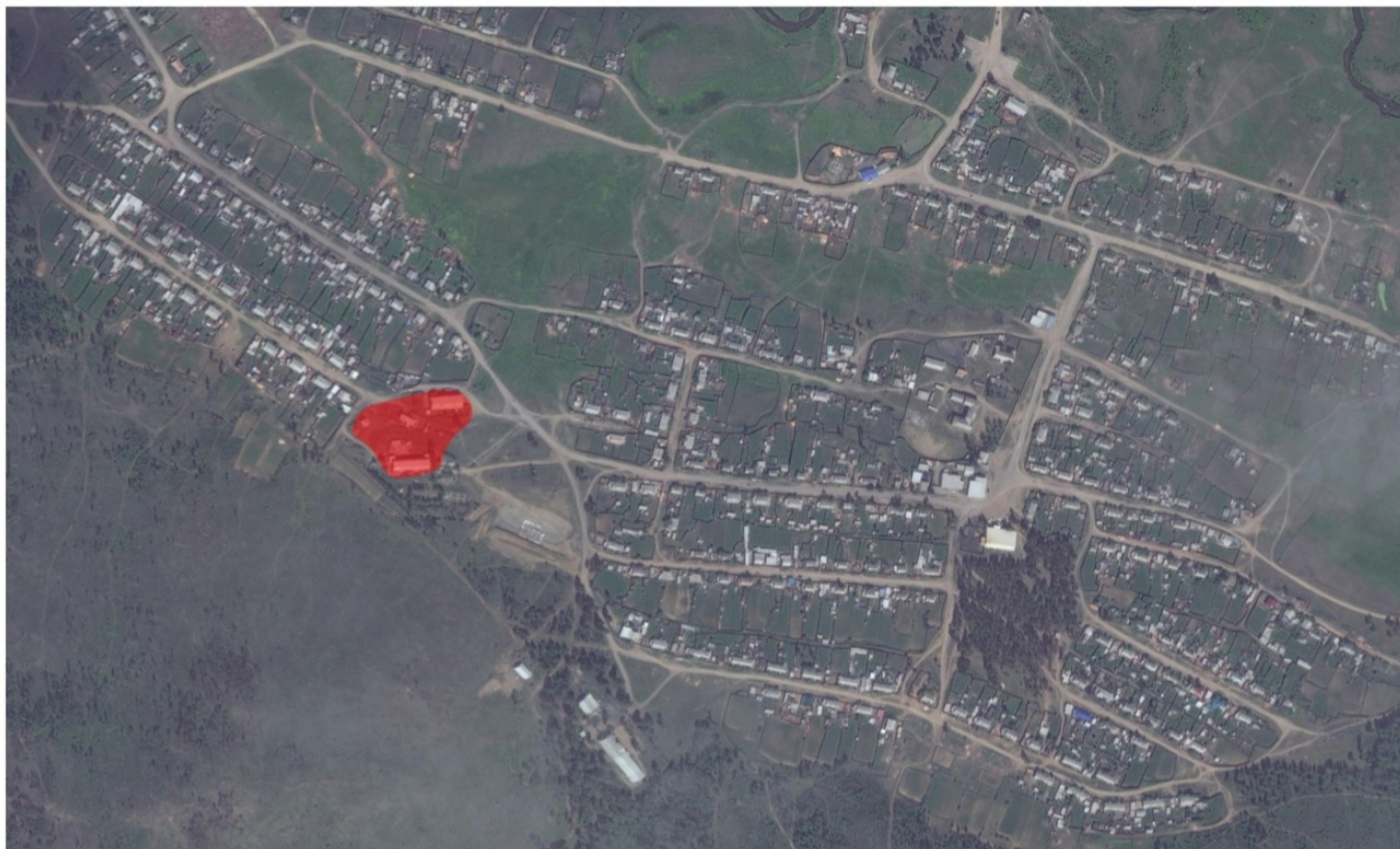
Рисунок 3. Зона действия Котельной детсад № 3 (ИНЗД-2).