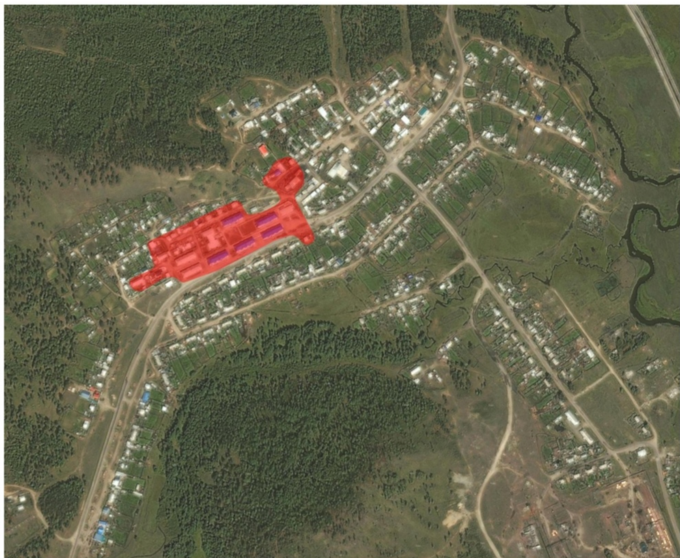
Рисунок 2. Зона действия Центральной Котельной (ИНСД-1)