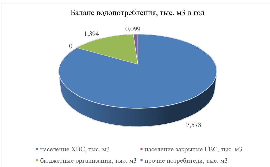
Рисунок 2. Диаграмма структуры водопотребления по группам потребителей

Основным потребителем холодной воды на территории муниципального образования является население (жилые здания), его доля составляет 83,5% от общего полезного отпуска. Доля бюджетных организаций в водопотреблении составляет 15,4%, прочих потребителей – 0,1%.