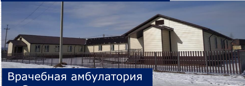
Врачебная амбулатория с. Смоленка