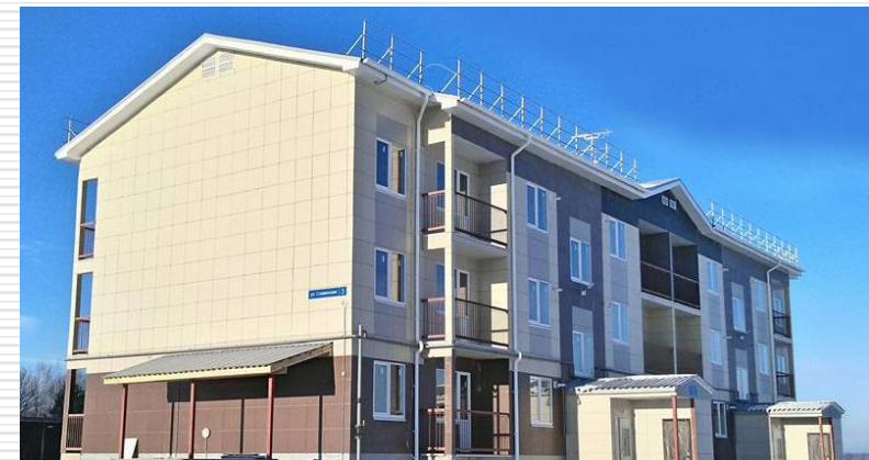
Многоквартирный жилой дом г. Ковров, Владимирская область