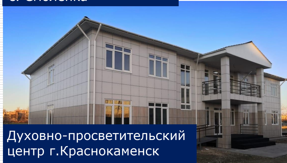
Духовно-просветительский центр г. Краснокаменск