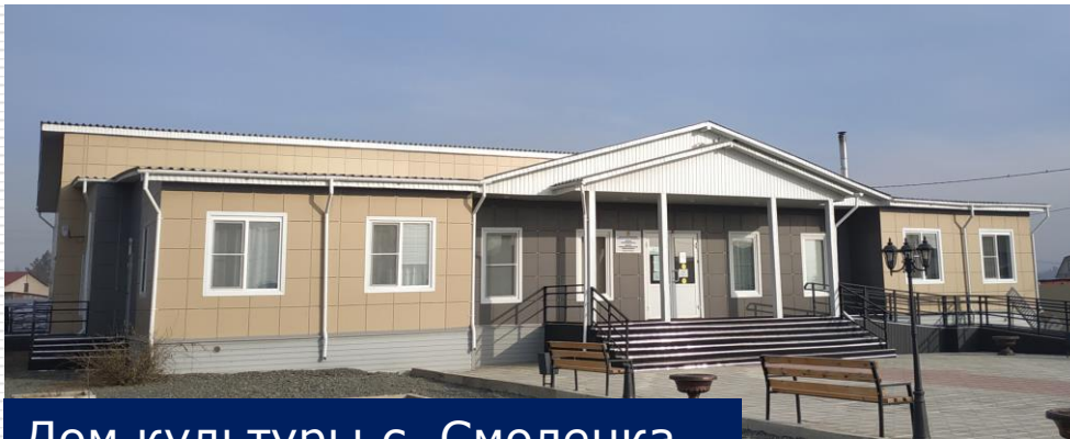
Дом культуры с. Смоленка