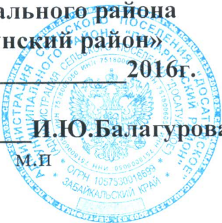
СХЕМА ВОДОСНАБЖЕНИЯ И ВОДООТВЕДЕНИЯ СЕЛЬСКОГО ПОСЕЛЕНИЯ «ДОСАТУЙСКОЕ» ПРИАРГУНСКОГО МУНИЦИПАЛЬНОГО РАЙОНА ЗАБАЙКАЛЬСКОГО КРАЯ ДО 2026 ГОДА