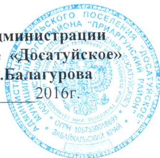
СХЕМА ТЕПЛОСНАБЖЕНИЯ СЕЛЬСКОГО ПОСЕЛЕНИЯ «ДОСАТУЙСКОЕ» МУНИЦИПАЛЬНОГО РАЙОНА ПРИАРГУНСКИЙ РАЙОН