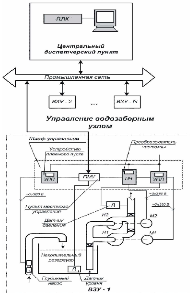
Рисунок 4 - Общая примерная функциональная схема автоматизации ВЗС

При реконструкции ВЗС необходимо предусмотреть автоматизированную систему управления объектами водоснабжения с возможностью, при соответствующем технико-экономическом обосновании, ее дальнейшего расширения и развития ее функциональности.