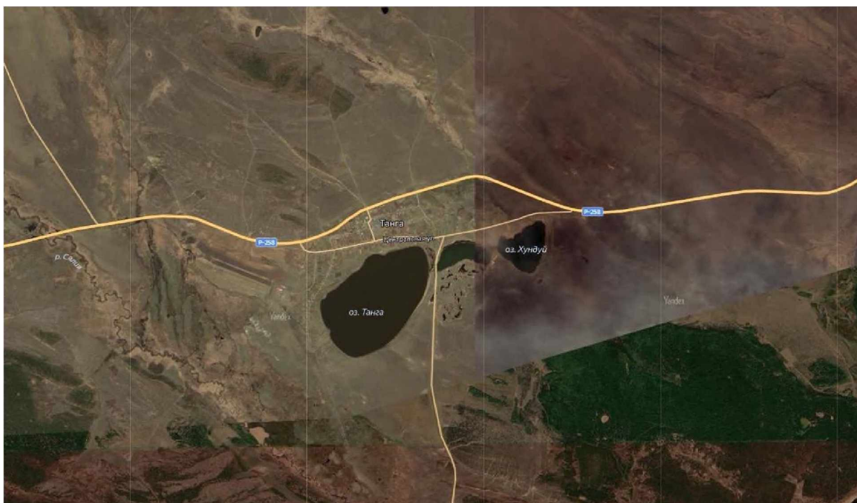
Рисунок 1. Расположение с. Танга

Читинско-Ингодинская впадина является самой крупной впадиной Забайкальского типа по длине и ширине. Ее общая длина равна 260 км, 190 из которых приходится на участок с р. Ингода, а 70 на участок с р. Чита. Улетовский отрезок впадины начинается на юго-западе, где имеет вдольширотное направление, а в районе села Николаевское приобретает северо-восточный азимут. Основные ландшафты во впадине – приречные луга, лесостепи, сосновые боры, переходящие выше по склонам в смешанные и хвойные леса.