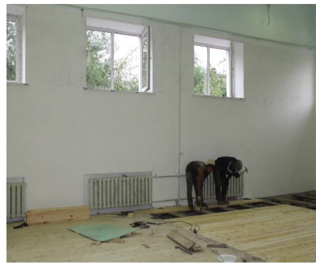
Замена полов в спортивном зале