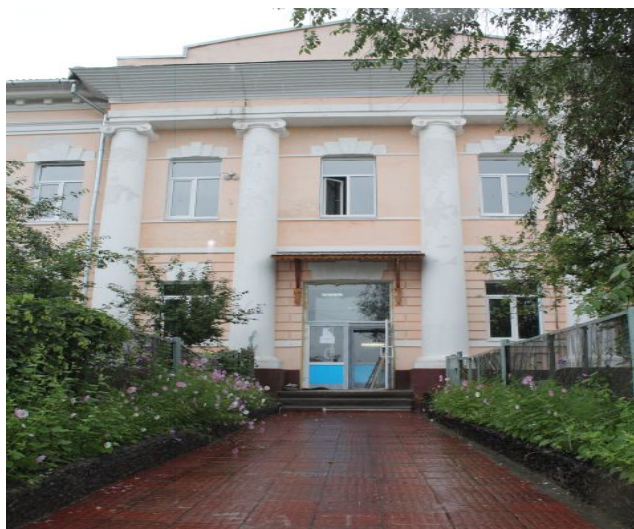
МБОУ СОШ №18 г. Читы