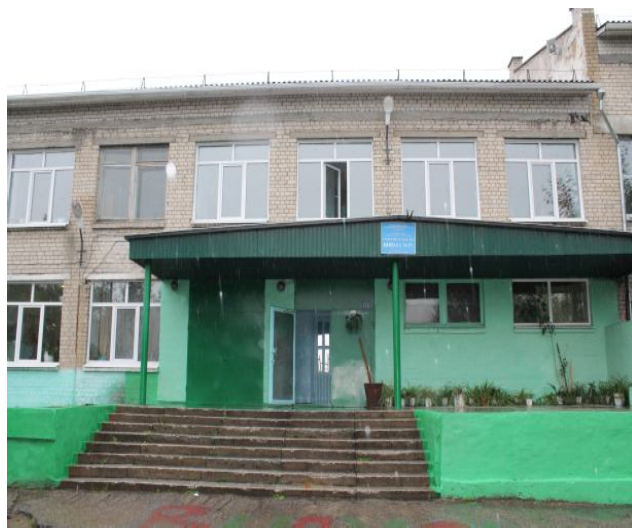
МБОУ СОШ №17 г. Читы