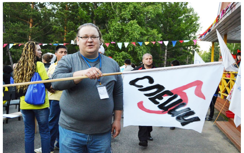
Текст Анастасии БАЛУЕВОЙ.

XII Всероссийская летняя школа молодого учёного, педагога-исследователя и лидера в молодёжной политике, без сомнения, оставила яркий и незабываемый след в сердцах участников. Молодые преподаватели не только переняли бесценный опыт, советы экспертов и профессоров, но также, благодаря священной земле, зарядились решимостью, отдохнули от привычной суеты и наполнились бодростью и жизнелюбием на весь учебный год.