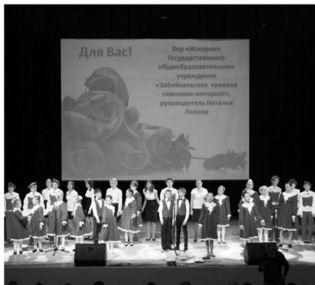
Хор "Искорки" Забайкальской краевой гимназии-интерната