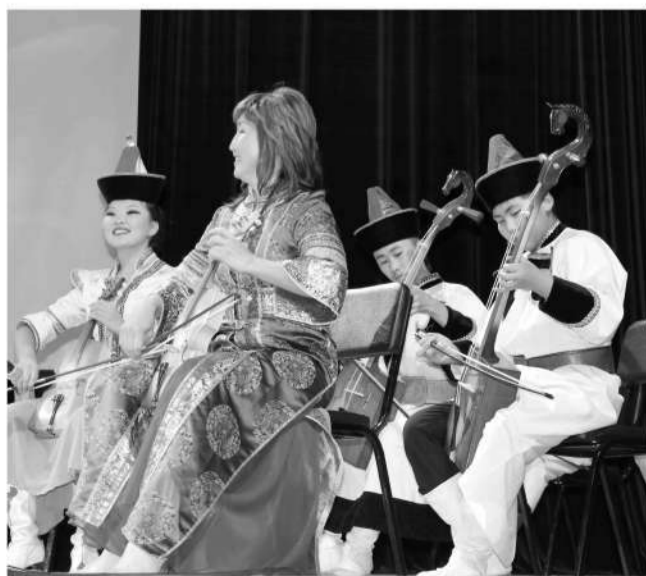
Детский оркестр бурятских народных инструментов "Булжамуур"