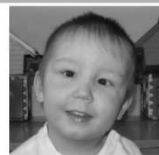
К., декабрь, 2008 г. Глаза карие, волосы русые. Мальчик спокойный, добрый.