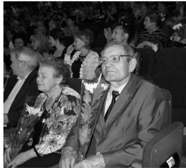
4 октября чествовали и ветеранов педагогического труда