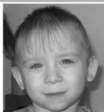
Д., июль 2009 г. Глаза голубые, волосы русые. Активный, подвижный, спокойный ребенок.

Уважаемые читатели! В нашей газете создана специальная рубрика, которая по замыслу редакции должна содействовать устройству детей-сирот в семьи к добрым и любящим родителям. В каждом номере мы будем публиковать фотографии нескольких малышей и краткую биографическую справку. Возможно, кто-то из вас решится взять к себе этих ребятшек. Желаящие получить подробную информацию о конкретном ребенке, могут сделать это при наличии полученного в органе опеки по месту жительства Заключения о возможности быть. Посмотреть анкеты детей можно на сайте Минобразования Забайкальского края http://минобр.зabaykalskiykray.rf/proekti/mami.html