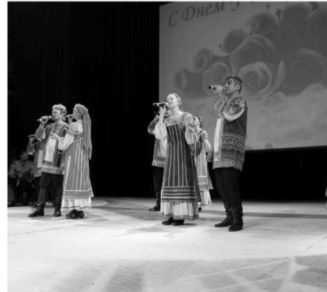
Концерт - подарок учителям от фольклорного театра "Забайкалье"