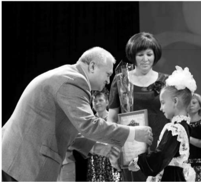
Обладатели Президентских грантов получили награды из рук Георгия Ревы