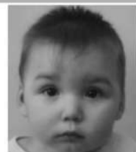
И., июль, 2010 г. Глаза серые, волосы русые. Общительный, доброжелательный, подвижный, активный мальчик.